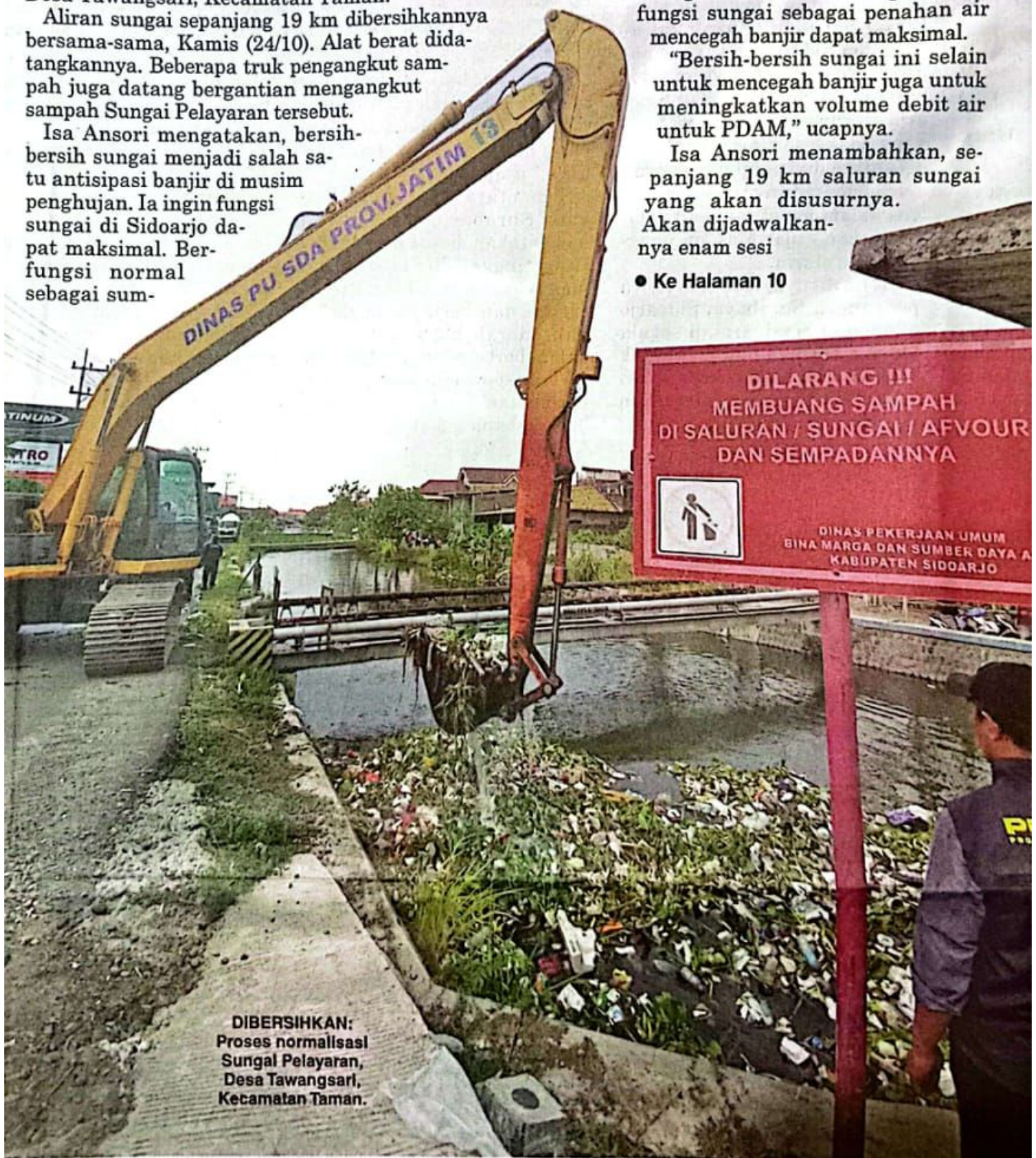
DIBERSIHKAN: Proses normalisasi Sungai Pelayaran, Desa Tawang Sari, Kecamatan Taman.