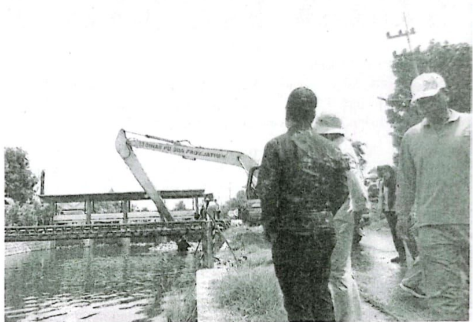
Pjs Bupati Sidoarjo M Isa Ansori memantau pembersihan Sungai Pelayaran di Tawangsari.

"Dengan begitu fungsi sungai sebagai penahan air mencegah banjir dapat maksimal. Bersih-bersih sungai ini selain dapat mencegah banjir juga untuk meningkatkan volume debit air