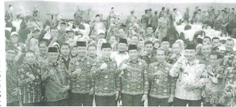
Pose bersama para Kades dan BPD dengan Plt Bupati Sidoarjo, H. Subandi.

Dalam upaya meningkatkan kualitas hidup masyarakat desa, Pemerintah Kabupaten Sidoarjo kembali menggelar Bimtek Jilid 2 pelatihan bagi Kepala Desa dan Badan Pemasyawaratan Desa (BPD) se-Sidoarjo. Selasa (17/9) di Hotel Mercure Grand Mirama, Surabaya.