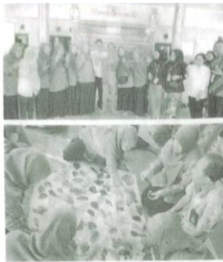
Kegiatan Pelatihan Ecoprint ibu PKK desa Lambangan.

Tawar (IPBIAT) Diangu Mojokerto dengan bahan ajar sebagai stimulan berupa kolam fiber beserta Instalasinya, benih lele dan pakan ikan. Semangat masyarakat untuk tetap optimis melakukan usaha budidaya lele. Ini terlihat dari antusiasnya saat mengikuti pembekalan dari tin narasumber. Choiri Kabid budidaya dan Produksi Dinas Perikanan Sidoarjo berharap stimulan ini merupakan spirit dan pemicu semangat untuk kembali bangkit menggerakkan roda ekonomi "Kam berharap nantinya ada peningkatan ekonomi keluarga khususnya dan lingkungan masyarakat sekitar pada umumnya, selanjutnya kegiatan tidak stagnan tetap bisa maju dan berkembang. Indikatornya adanya peningkatan jumlah kolam yang terisi oleh budidaya ikan produksinya selalu naik peningkatan pendapatan dan daya beli masyarakat serta kesejahteraan keluarga dan masyarakat tercapai, tuturnya. (Met/ADV)