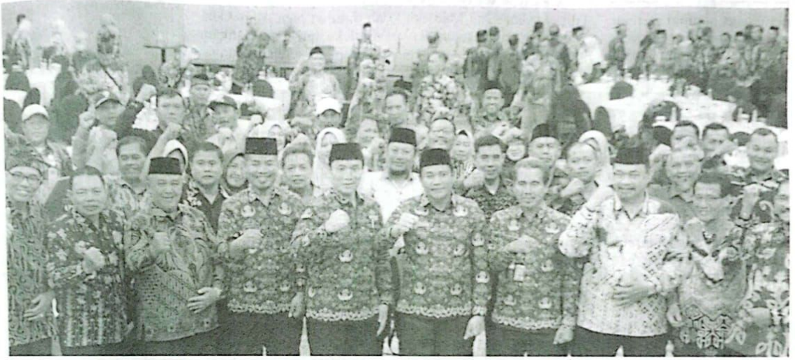
Pose bersama para Kades dan BPD dengan Plt Bupati Sidoarjo, H. Subandi.

“Untuk itu, kepala desa harus menjadi pemimpin yang inspiratif dan mampu membawa desanya menuju kemajuan,” ujar Subandi, dalam sambutannya.