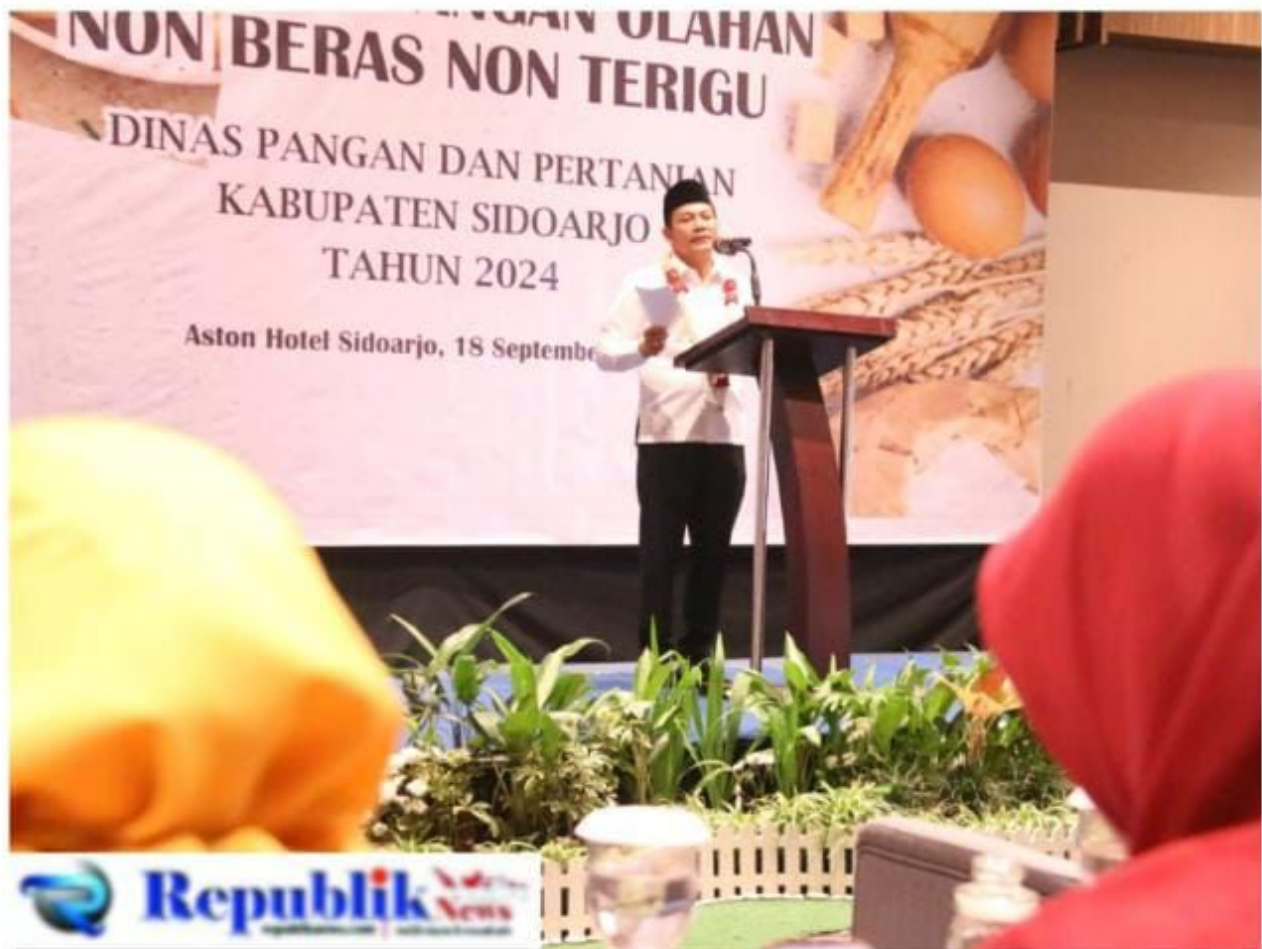
Foto : plt Bupati Sidoarjo menghadiri pelatihan pangan olahan non pangan di Ballroom Aston Kahuripan Hotel

Republiknews.com, Sidoarjo. Pemerintah Kabupaten Sidoarjo melalui Dinas Ketahanan Pangan dan Pertanian, mengajak para pendidik yang tergabung dalam IGTKI Kab.Sidoarjo dengan pelatihan pangan olahan Non Pangan Beras serta Non Terigu yaitu berupa singkong Tahun