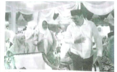
Pt Bupati Sidoarjo H Subandi, SH, MKn saat membuka Pasar Rakyat Sidobudoyo.

Sumarikh berharap kegiatan ini dapat meningkatkan kreativitas anggota PKK Desa Lambangan, sehingga masyarakat Desa Lambangan dapat lebih mengenal ecoprint sebagai metode pemanfaatan bahan-bahan alam untuk menghasilkan produk yang unik, kreatif dan tetap memperhatikan prinsip ramah lingkungan. (dy/khol)