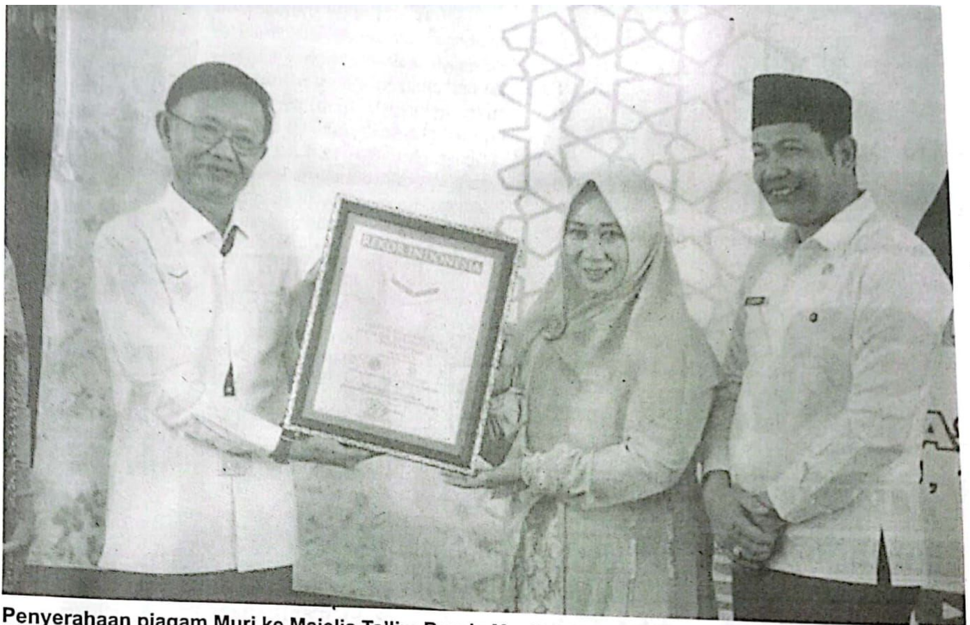
Penyerahaan piagam Muri ke Majelis Ta'lim Bunda Muslimah Az Zahra.

DEWAN PERWAKILAN RAKYAT DAERAH KABUPATEN SIDOARJO