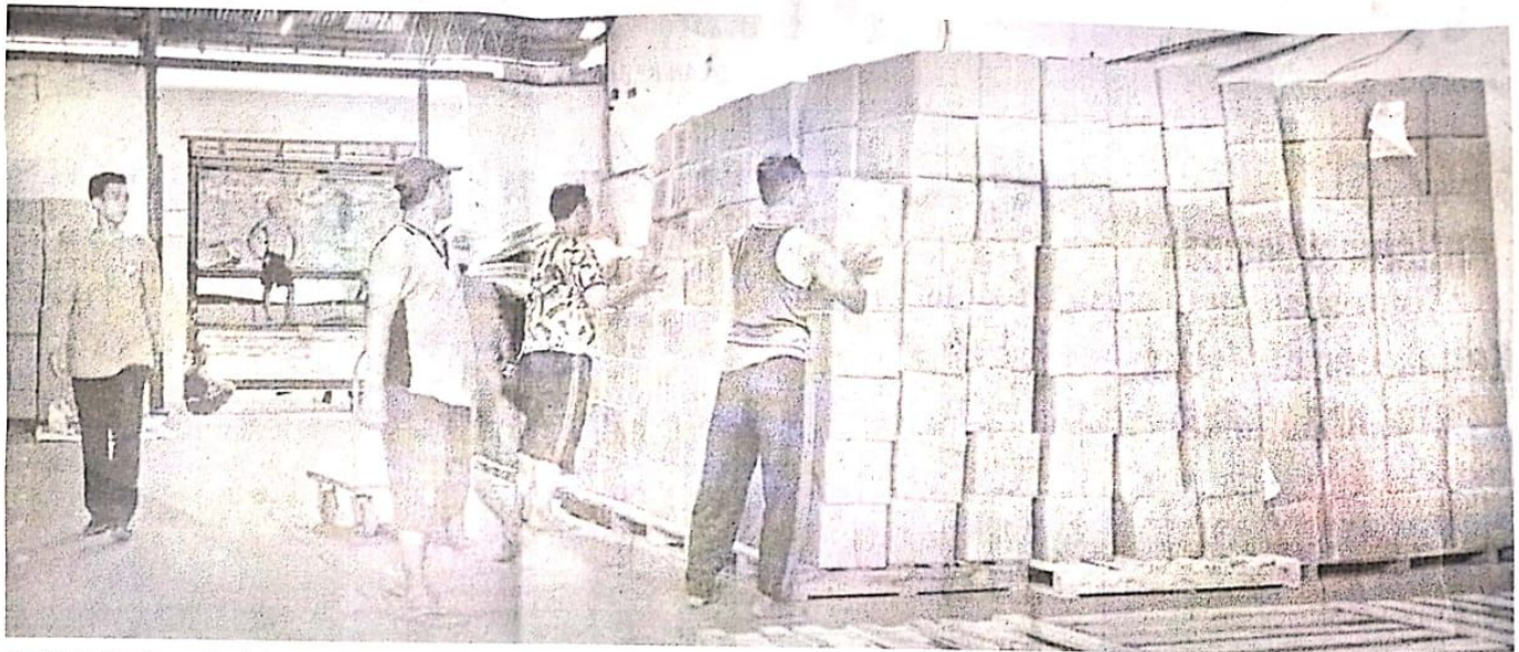
BERTAHAP: Surat suara Pemilu 2024 yang sudah tersimpan di gudang milik KPU Sidoarjo.