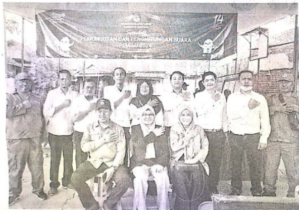
PERSIAPAN: Pelaksanaan simulasi pencoblosan di Desa Suko, Sidoarjo.