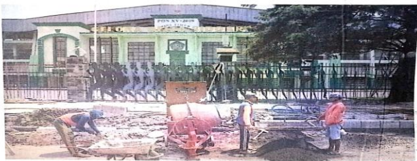
TAK SAMPAI SEMINGGU Pekerja menggarap trotoar depan GOR Delta. Hingga kemarin, belum ada tanda-tanda jika pengerjaan akan tuntas.