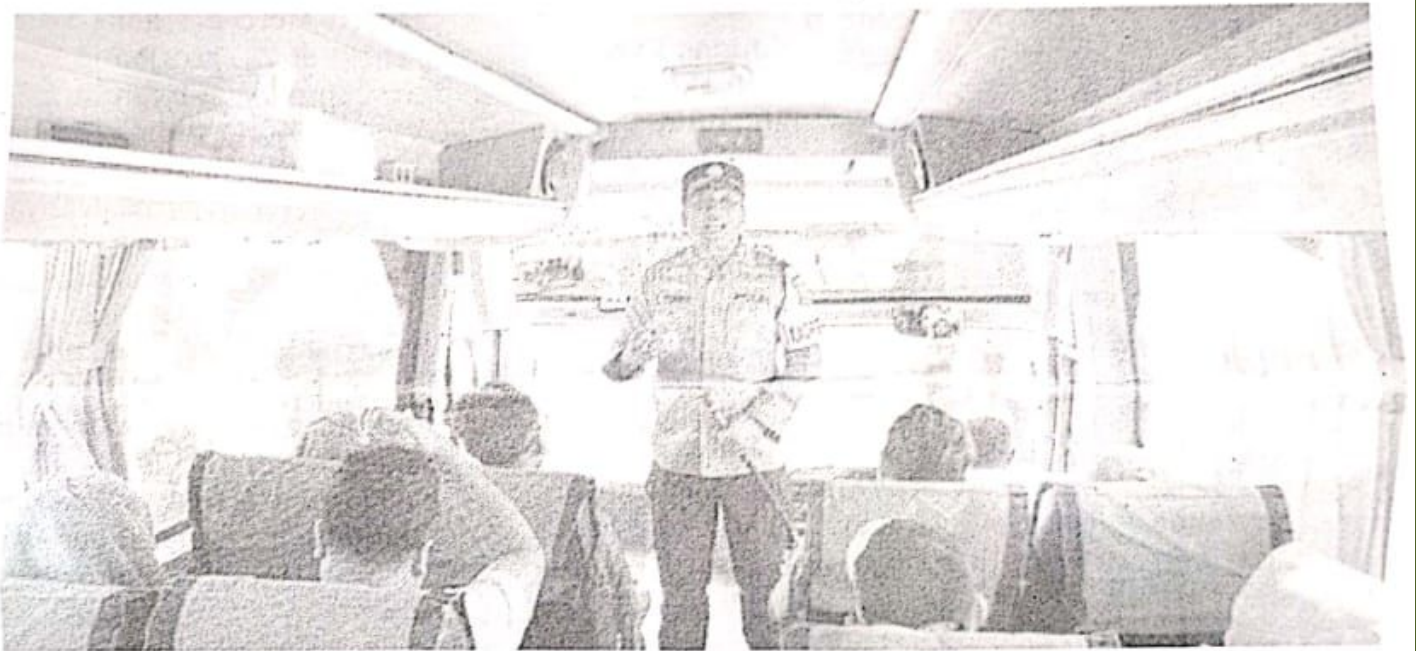
Kapolresta Sidoarjo AKBP Christian Tobing saat berbincang dengan penumpang bus di Terminal Purabaya.