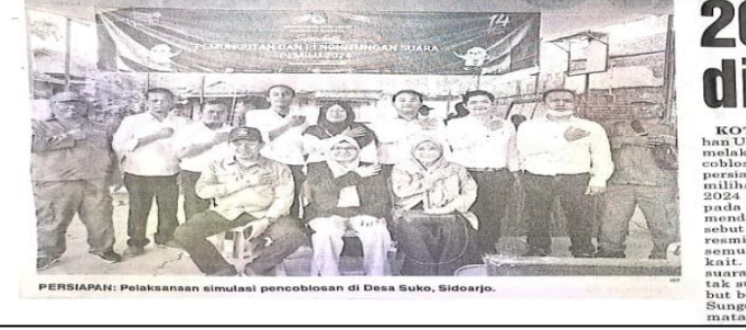
PERSIAPAN Pelaksanaan simulasi pencoblosan di Desa Suko, Sidoarjo.