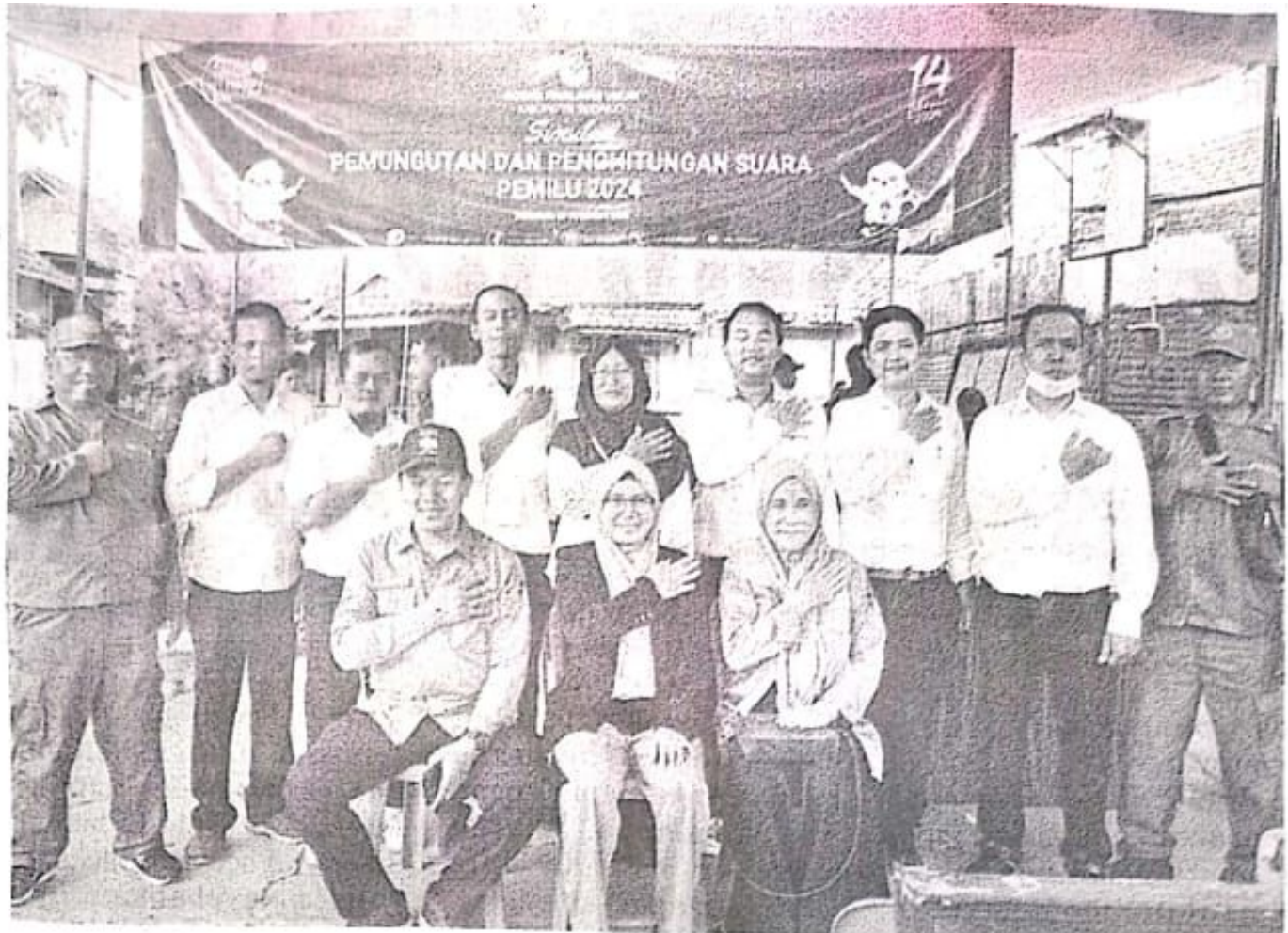
PERSIAPAN: Pelaksanaan simulasi pencoblosan di Desa Suko, Sidoarjo.