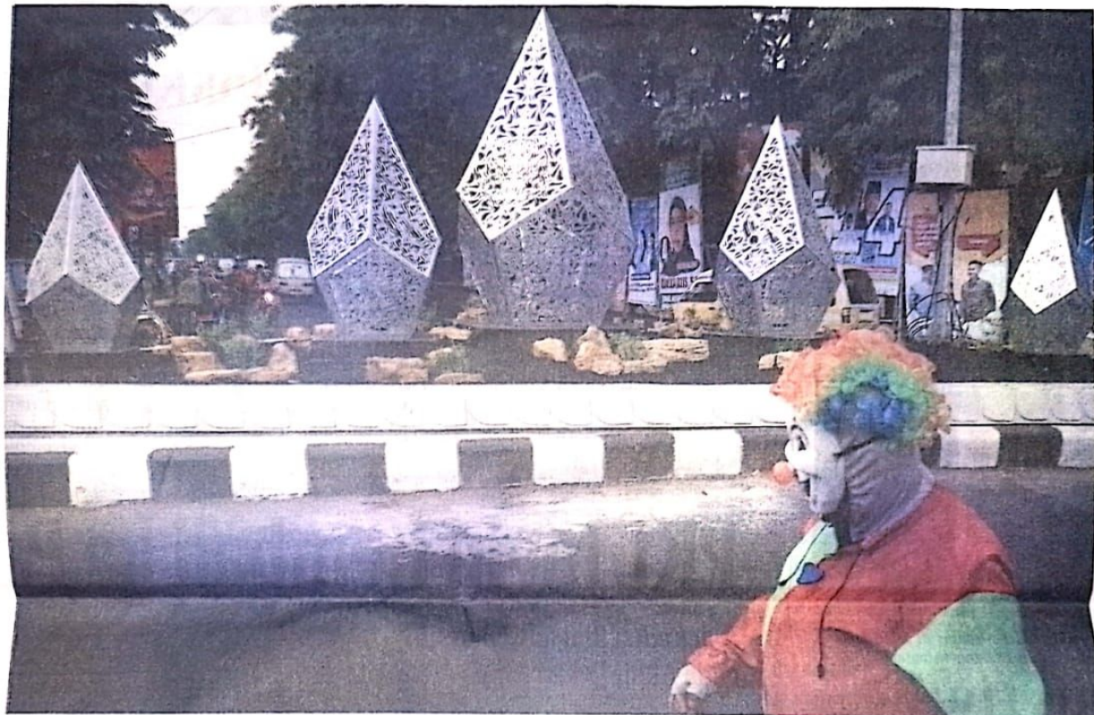
ARTISTIK: Seorang badut melewati taman pulau depan Pasar Larangan. Tampak ornamen berbentuk gunung dengan ukiran udang dan bandeng.