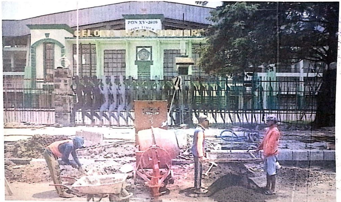
TAK SAMPAI SEMINGGU: Pekerja menggarap trotoar depan GOR Delta. Hingga kemarin, belum ada tanda-tanda jika pengerjaan akan tuntas.

Kepala Bidang Kebersihan dan Ruang Terbuka Hijau