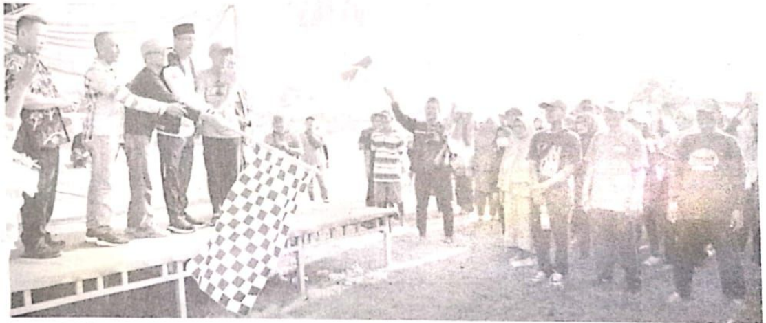
Bupati saat Mlaku Bareng bersama Kawula Muda Banjarsari.