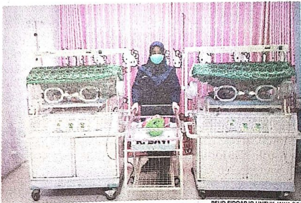
RSUD SIDOARJO UNTUK JAWA POS

Meskipun ada bayi yang perlu perawatan di inkubator. Salah satunya karena berat badan rendah. Yakni, kurang dari berat 2,5 kilogram. (may/c19/any)