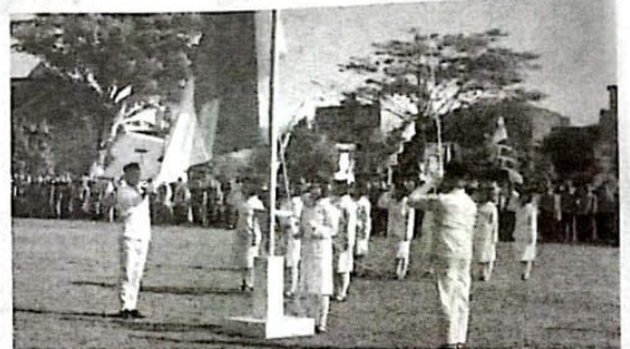
Pengibaran bendera merah putih di lapangan Desa Pepelegi, Waru.

upacara detik detik proklamasi di lapangan desa pepelegi ini merupakan wujud partisipasi dan ungkapan kebahagiaan warga dalam