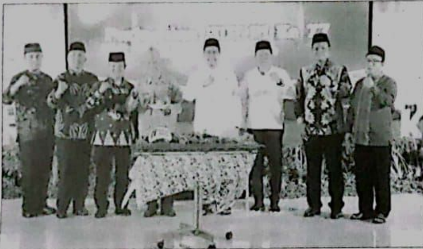
TASYAKURAN: Tasyakuran HUT ke 77 RI di Pendopo Sidoarjo diawali dengan membaca shalawat bersama dilanjutkan pemberian santunan kepada anak yatim piatu.

Gus Ali melanjutkan bahwa nikmat hidup, nikmat kemerdekaan dan nikmat hidayah ketiga nikmat ini harus disyukuri. Apabila mau membaca sejarah perjuangan bangsa bahwa kemerdekaan ini bukan hadiah dari penjajah namun sudah banyak melalui perjuangan panjang, melalui pengorbanan yang banyak bahkan nyawa dipertaruhkan untuk mewujudkan Indonesia Merdeka. "Maka saya tekankan dimana-mana bahwa urgensi sanat keilmuan yaitu ilmu yang manfaat dan berkah," pungkasnya. (udi)