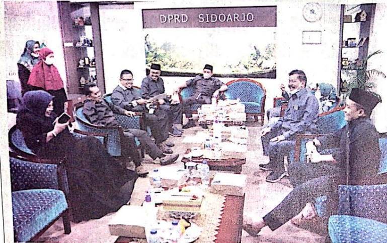
DISKUSI: Panitia khusus (pansus) XIV saat membahas pembentukan raperda pengelolaan zakat, infaq, dan shodaqoh beberapa waktu lalu.