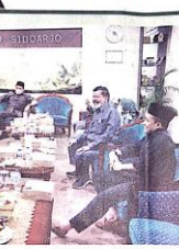
Peringatan 77 tahun kemerdekaan RI di Kabupaten Sidoarjo, Rabu (17/8).