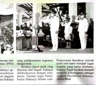
Wali Murid Menjerit Biaya Sekolah SMAN Mahal