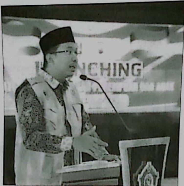
Bupati Sidoarjo H. Ahmad Muhdlor Ali

Dimintanya sosialisasi mencegah kekerasan terhadap perempuan dan anak gencar dilakukan. Bahkan sosialisasi diharapkan dilakukan sampai tingkat sekolah. "Sosialisasi harus