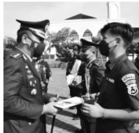
Salah satu anggota Polresta Sidoarjo yang mendapatkan penghargaan.

"Sehingga berbagai prestasi pelayanan publik yang sudah kita raih dapat dipertahankan. Tentunya disusul berbagai penghargaan lainnya ke depan," lanjut Kombes Pol. Kusumo Wahyu Bintoro. (cat/rd)