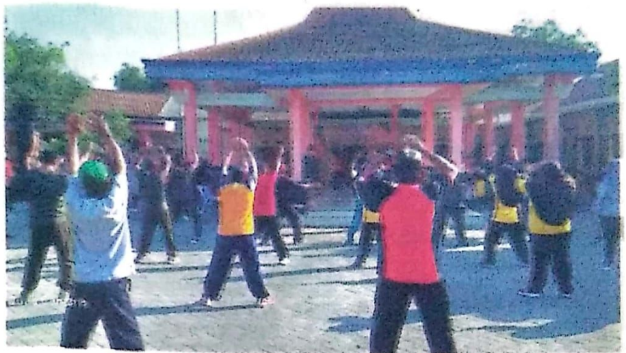
SKJ di halaman Pendopo Desa Mulyodadi.

Senam Kesegaran Jasmani merupakan bentuk latihan kebugaran dengan rangkaian gerakan tertentu dengan iringan musik atau lagu, yang dikenal masyarakat. "Banyak yang ikut. Apalagi gerakan SKJ tergolong mudah sehingga dapat dilakukan dari beragam usia," terang Eko Purnomo, kader pemuda yang