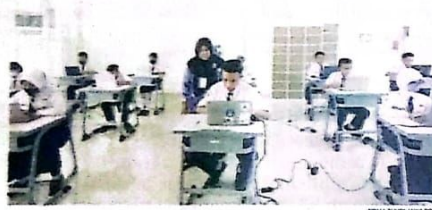
FOKUS: Para siswa SMP Hang Tuah 6 Excellent saat mengikuti asesmen nasional berbasis komputer (ANBK) hari pertama di sekolah mereka kemarin (18/9).

Berdasar hasil ANBK tahun sebelumnya, skor kemampuan