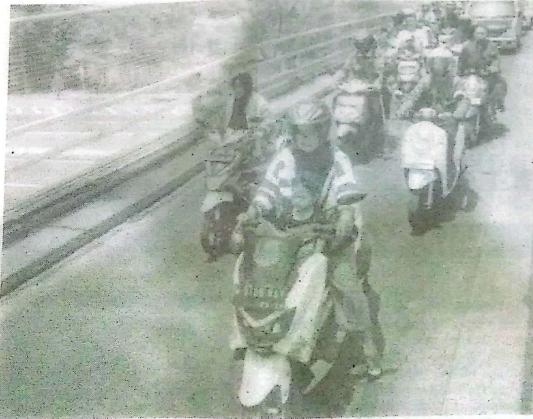
Pengguna jalan terjebak kemacetan di overpass Sepande, Candi.

ini. "Lebarnya sekitar 6-7 meter. Posisinya dari timur ke barat di atas tol Sidoarjo," katanya.