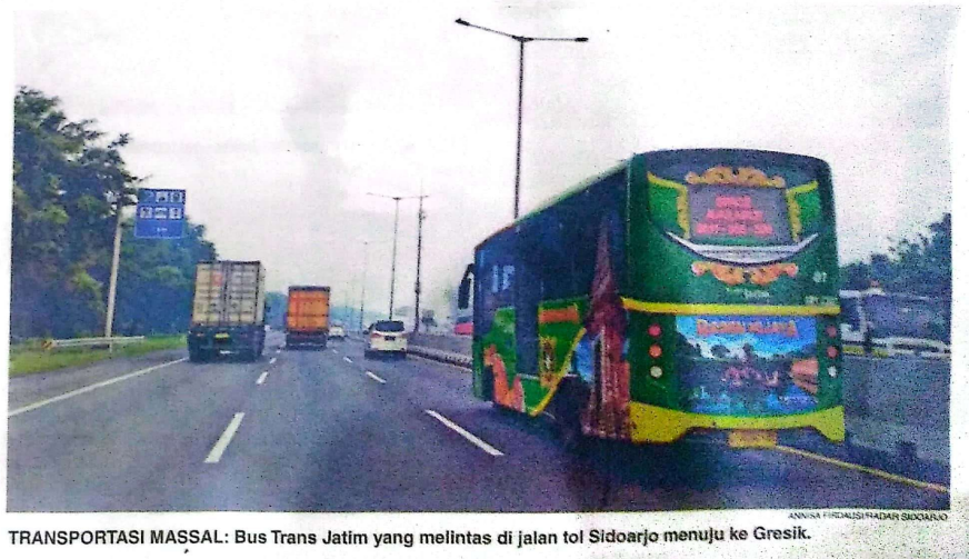
TRANSPORTASI MASSAL: Bus Trans Jatim yang melintas di jalan tol Sidoarjo menuju ke Gresik.