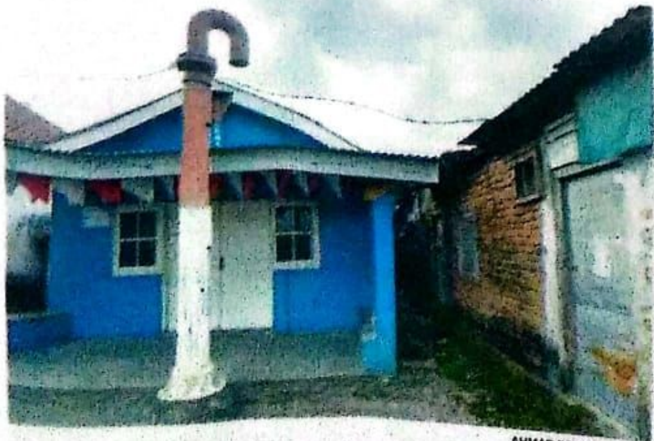
MASIH ADA: Pipa dan keran untuk mengisi air ke lokomotif di Stasiun Krian kemarin (18/9).

...apan menarik gerbong-gerbong. (eza/c6/any)