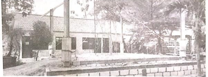
Progres gedung kemasyarakatan capai 50 Persen.

Rencana pembangunan balai pertemu terwujud minimal berupa semi pendopo dengan ukuran bangunan 8X7 m, menghabiskan anggaran Rp.100 juta bisa terwujud di tahun 2023 ini, sehingga