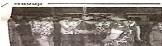
Wabup Sidoarjo Subandi dalam syukuran ruwah Desa Semampir Kec. Sedati, Minggu (17/9/23) malam.

dan masyarakat. Kegiatan yang dilakukan dengan semangat dan benar tentu hasilnya badan terasa bugar. Untuk membuat hidup sehat tentu melakukan aktivitas yang teratur dan pola makan yang baik, ini semua perlu adanya penyusunan program hidup sehat yang lebih terstruktur. (zam/jok/epe)