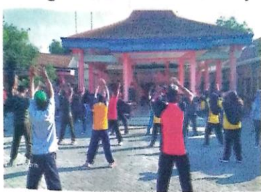
SKJ di halaman Pendopo Desa Mulyodadi.

Sidoarjo, Memorandum Untuk menjaga kebugaran tubuh agar badan tetap sehat dan imun tetap terjaga, senam kesegaran jasmani (SKJ) dilaksanakan rutin setiap Jumat pagi. Agenda ini diadakan bergilir di setiap desa. Terakhir, digelar di halaman Pendopo Desa Mulyodadi (15/9). Acara itu dihadiri Forkopimcam Wonoayu, kades dan jajaran, RT/RW, kader PKK, pemuda desa, dan warga. SKJ dinilai menjadi kebutuhan setiap individu dalam menjaga kondisi tubuh maupun kondisi fisiknya, terutama jika dilakukan secara rutin.