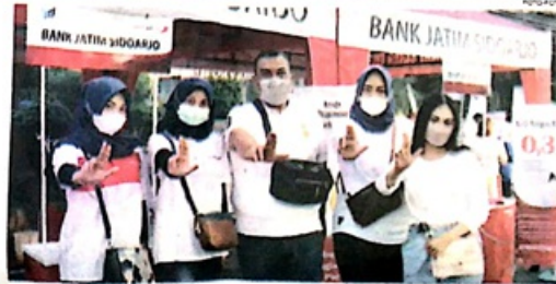
UNGGULAN: Tenan Bank Jatim tawarkan produk perbankan terbaik.