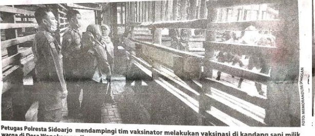
Petugas Polresta Sidoarjo mendampingi tim vaksinator melakukan vaksinasi di kandang sapi milik warga di Desa Wonokarang, Kecamatan Balongbendo, Sidoarjo.

bantu pencegahan penyebaran PMK ini. Seperti umum (29/7) lalu di Desa Wonokarang," ucap Kapolsek Balongbendo, Minggu (31/7). Kegiatan vaksinasi ini bertujuan agar kesehatan hewan ternak khususnya di wilayah Kabupaten Sidoarjo dapat terhindar dari wabah PMK yang tengah merebak. (jok/mik)