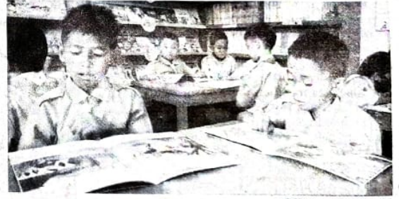
CERIA: Siswa SDN Ketegan Tanggulangin sedang asyik membaca dan melihat gambar di buku perpustakaan ramah anak.

Kepala SDN Ketegan Tanggulangin Vicky Agung Pratama mengungkapkan, pihaknya cukup terbantu dengan hadirnya LSM Mutiara Rindang. Sebagai tindak lanjut, para guru di