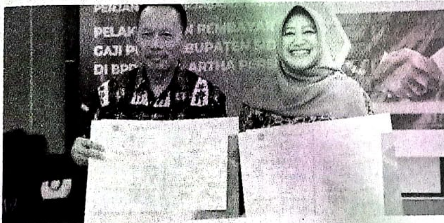
Kerja sama pembayaran gaji guru PPPK antara Dikbud Sidoarjo dan BPR Delta Artha.

Diketahui, jumlah guru PPPK Sidoarjo yang pembayaran gajinya melalui BPR Delta Artha, sebanyak 1.984 orang. Guru PPPK ini merupakan guru yang lolos seleksi tahap I dan tahap II. (sta/rd)