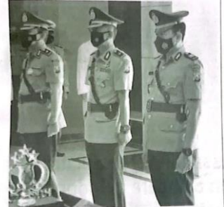
SERTIJAB - Kapolresta Sidoarjo Kombes Pol Kusumo Wahyu Bintoro memimpin upacara Sertijab Kabaglog dan Kapolsek Candi di ruang Lobi Polresta Sidoarjo, Jumat (29/07/2022).