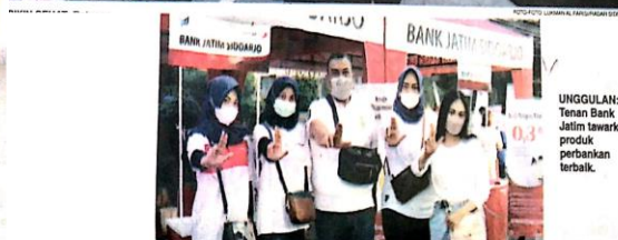
UNGUJUAL: Tenan Bank Jatim tawarkan produk perbankan terbaik.

Dipandu seorang instruktur, ratusan emak-emak langsung berolahraga dengan senam gerakan senam. Rupanya mereka merupakan binaan Komite Olahraga Masyarakat Indonesia (Kormi) Sidoarjo. Uniknaya lagi, setiap pekannya, kegiatan senam pagi bersama tersebut diikuti induk organisasi (Ke Halaman 10)