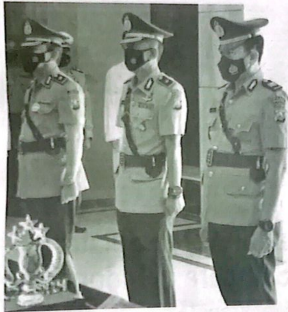
SERTIJAB - Kapolresta Sidoarjo Kombes Pol Kusumo Wahyu Bintoro memimpin upacara Sertijab Kabaglog dan Kapolsek Candi di ruang Lobi Polresta Sidoarjo, Jumat (29/07/2022).