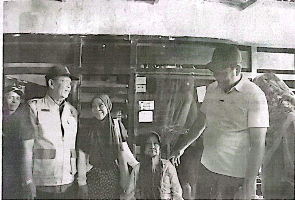
Bupati Sidoarjo Subandi sidak rumah tidak layak huni (RTLH) di Desa Pabean, Kecamatan Sedati.

Kondisi rumahnya tadi kita lihat kamar mandinya tidak layak, biar nanti kita benahi, kalau hujan rumah ini banjir karena atapnya bocor, nanti juga ada peningkatan dan lantai akan kita eram, serta ventilasinya juga