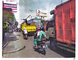
PADAT: Kemacetan rutin terjadi di Jalan Raya Gedangan.

Pemkab Target Tuntas Enam Bulan GEDANGAN-Pemerintah Kabupaten (Pemkab) Sidoarjo memprioritaskan proses pemetaan dan pendataan seluruh objek tanah yang terdampak pembangunan Flyover Gedangan. Langkah tersebut dilakukan untuk mempercepat proses pembebasan lahan sebelum proyek strategis itu memasuki tahap konstruksi. Bupati Sidoarjo Subandi mengatakan, proses pendataan telah berjalan dan melibatkan pemerintah kecamatan serta pemerintah desa di wilayah terdampak. Pendataan dilakukan secara menyeluruh menggunakan pemetaan tidak ada pemolaan yang dapat menghambat pelaksanaan proyek di kemudian hari.