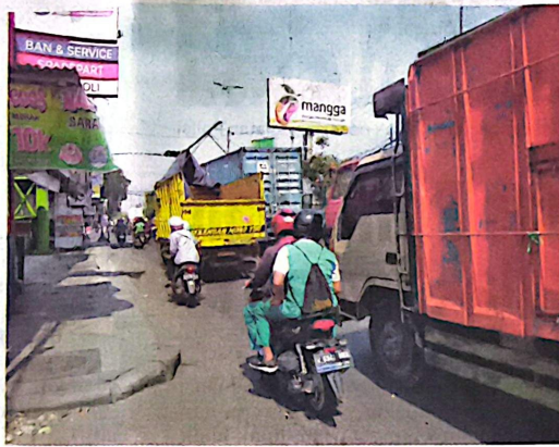
PADAT: Kemacetan rutin terjadi di Jalan Raya Gedangan.

Bupati Sidoarjo Subandi mengatakan, proses pendataan telah berjalan dan melibatkan pemerintah kecamatan serta pemerintah desa di wilayah ter-