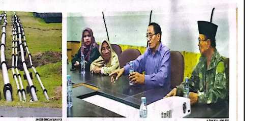
BEUM TUNTAS: Pipa pembangunan Lumut Sidoarjo terbangun langsung dengan kil Perorog. Foto kanan, korben Lumut Sidoarjo (dua dari kiri) didampingi Ketua BSN (dua dari kanan) berkunjung ke kantor retribusi Jawa Pas, Gela Pena Surabaya, kemarin (3/6).