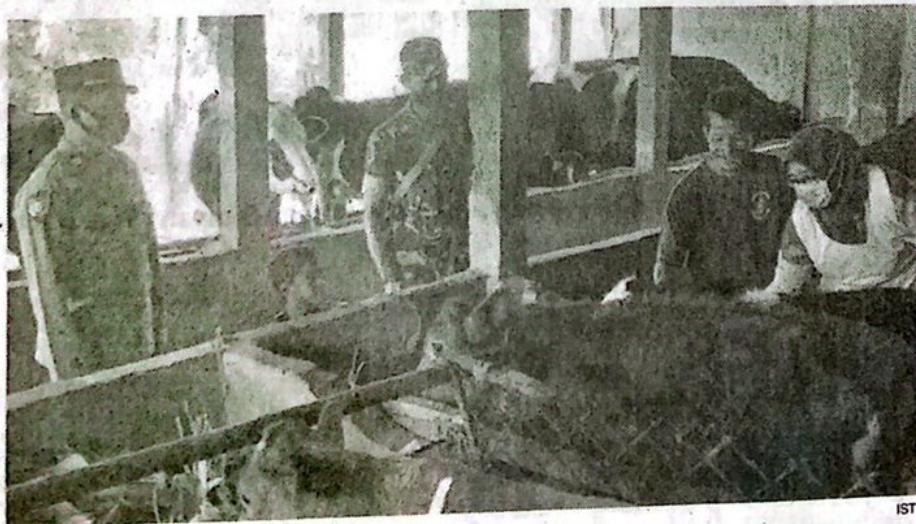
TAMBAH SEHAT: Puluhan sapi ternak milik warga di Prambon saat menjalani vaksinasi booster.