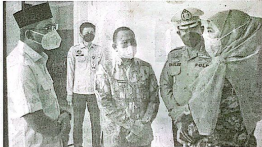
PEMASUKAN: Gubernur Jatim Khofifah Indar Parawansa didampingi Bupati Sidoarjo Ahmad Muhdlor dalam peresmian kantor baru UPT Bapenda Jatim.

Sementara itu, Abimanyu menambahkan, pembangunan kantor baru itu dimulai sejak 2021 lalu. Dengan merapat alih dari Anggaran Pendapatan dan Belanja Daerah (APBD) Provinsi