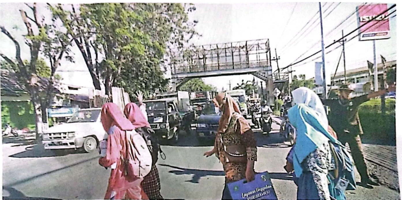
ARUS LALU LINTAS TERSENDAT: Pejalan kaki menyeberang di jalan raya. Padahal, ada JPO di dekatnya di kawasan Aloha, Gedangan, Sidoarjo, kemarin.

DEWAN PERWAKILAN RAKYAT SIDOARJO KABUPATEN SIDOARJO