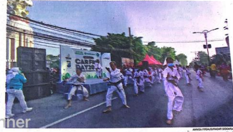
PRESTASI: Atlet Indonesia Traditional Karate Federation (INATKF) Sidoarjo saat tampil di CFD, Minggu (24/7) lalu.

Komite Olahraga Rekreasi Masyarakat Indonesia (KORMI) Sidoarjo menorehkan prestasi dalam Festival Olahraga Rekreasi Masyarakat Nasional (FORNAS) VI di Sumatera Selatan. Sebanyak 14 medali emas berhasil dibawa pulang dari 13 arena perombaan induk organisasi (inorga).