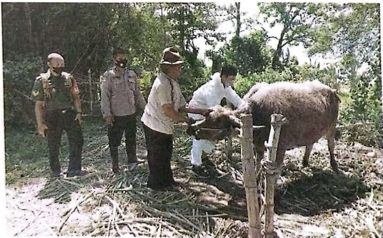
ANTISIPASI: Petugas Polsek bersama Koramil Porong mendampingi tim vaksinasi penyakit mulut dan kuku (PMK) di Desa Kebonagung, Kecamatan Porong, kemarin.

"Kami juga membuka layanan pengaduan bila masyarakat menemukan adanya gejala-gejala penyakit mulut dan kuku pada hewan ternak," lanjutnya. (eza/c12/any)