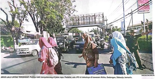
ARUS LALU LINTAS TERSEDAT: Pemandangan dari jalannya. Padahal, ada JPO di dekatnya di kawasan Aloha, Gedangan, Sidoarjo, kemarin.