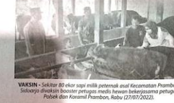
SAKSI: Sekitar 80 ekor sapi milik peternak asal Kecamatan Prambon, Sidoarjo yang menjalani vaksinasi booster PMK dan Karantina Prambon, Rabu (27/07/2022).