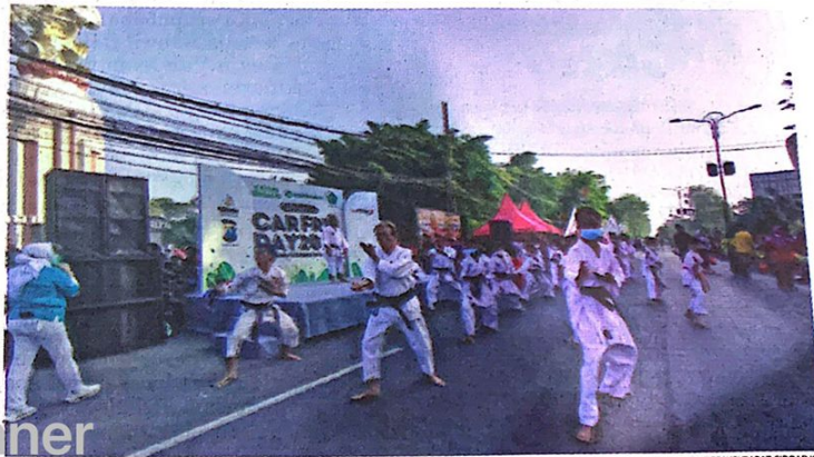
PRESTASI: Atlet Indonesia Traditional Karate Federation (INATKF) Sidoarjo saat tampil di CFD, Minggu (24/7) lalu.