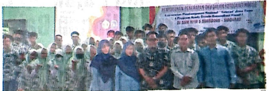
BERSAMA: Para siswa dan guru SMK YPM 5 Sukodono didampingi dosen Universitas Pembangunan Nasional UPN Veteran Jawa Timur saat mengikuti Workshop Penerapan DKV dalam fotografi dan kemasan

Ada tiga materi yang diberikan dalam workshop tersebut. Pertama, desain kemasan. Siswa diberi pengetahuan bahwa kemasan adalah hal pertama yang dilihat oleh pembeli. Se-