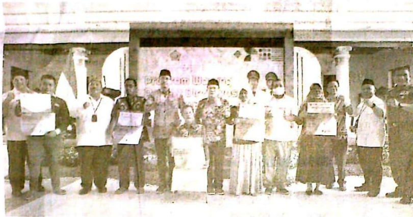
Bupati Sidoarjo Ahmad Muhdlor mengundang pemilik warung penerima manfaat program ke pendopo Delta Wibawa.

Rabu (7/12), Bupati Gus Muhdlor mengundang para pemilik warung penerima manfaat program tersebut ke pendopo Delta Wibawa. Bupati alumni SMAN 4 Sidoarjo itu menyampaikan terima kasih kepada penerima program dan para stakeholder yang turut membantu. Pada kesempatan itu,