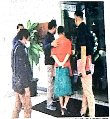
PIDANA: Tersangka saat dilimpahkan ke Kejari Mojokerto.