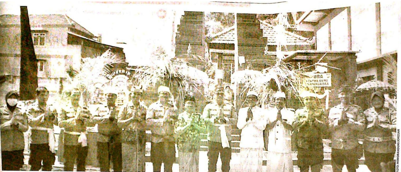
Prosesi melaspas yang dilakukan umat Hindu di Pura Kertha Bumi Bhayangkara.