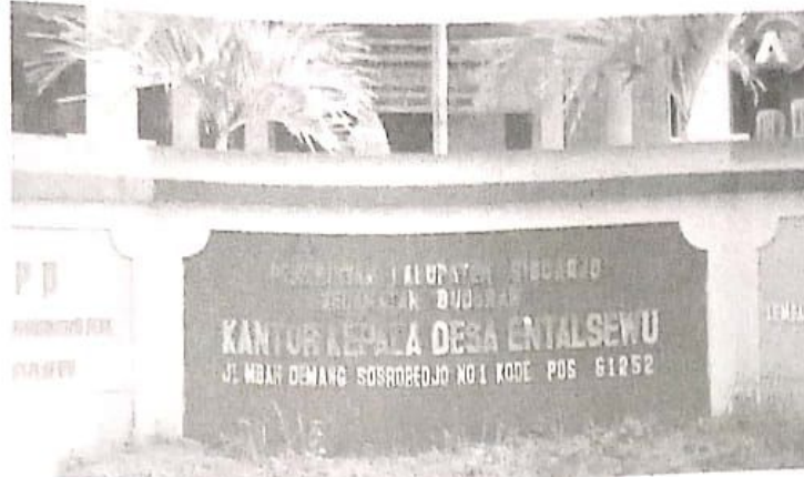
Lokasi tanah sawah Entalsewu yang akan diurug