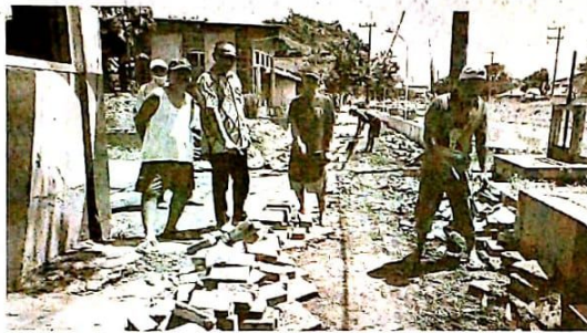
Kades Keboan Sikep Sentot menunjukan bekas galian proyek SPAM yang sudah diperbaiki warga secara swadaya dan warga sedang memperbaiki jalan bekas galian SPAM di Desa Keboan Sikep, Selasa (20/12/22)

Namun sayangnya tidak sedikit dampak dari proyek tersebut menyisahkan masalah dan protes warga atas kekecewaan