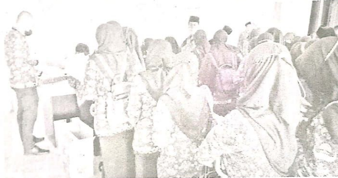
Para CPNS Kab Sidoarjo tahun 2020, berdiri antri mengambil SK PNS, di mal pelayanan publik (MPP) Sidoarjo.

Dalam kesempatan itu, Bupati Sidoarjo Ahmad Muhdlor Ali, secara seremonial sempat mengambil sumpah janji, sekaligus