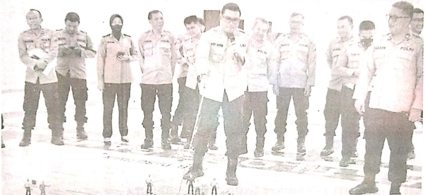
Latihan Praoperasi (Latpraops) Lilin Semeru 2022 dengan Tactical Floor Game (TFG).

Sidoarjo - HARIAN BANGSA Jelang pelaksanaan Operasi Lilin Semeru 2022, dalam rangka mengamankan Hari Raya Natal dan Tahun Baru 2023, Polresta Sidoarjo menggelar Latihan Praoperasi (Latpraops) Lilin Semeru 2022, Rabu (21/12) di Gedung Serbaguna Polresta Sidoarjo.