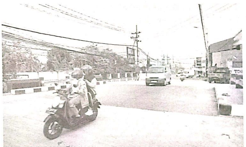
Proyek jembatan kali Cantel sudah dibuka dan bisa dilewati semua kendaraan

"Proyek Jembatan Kali Cantel sudah selesai semua,