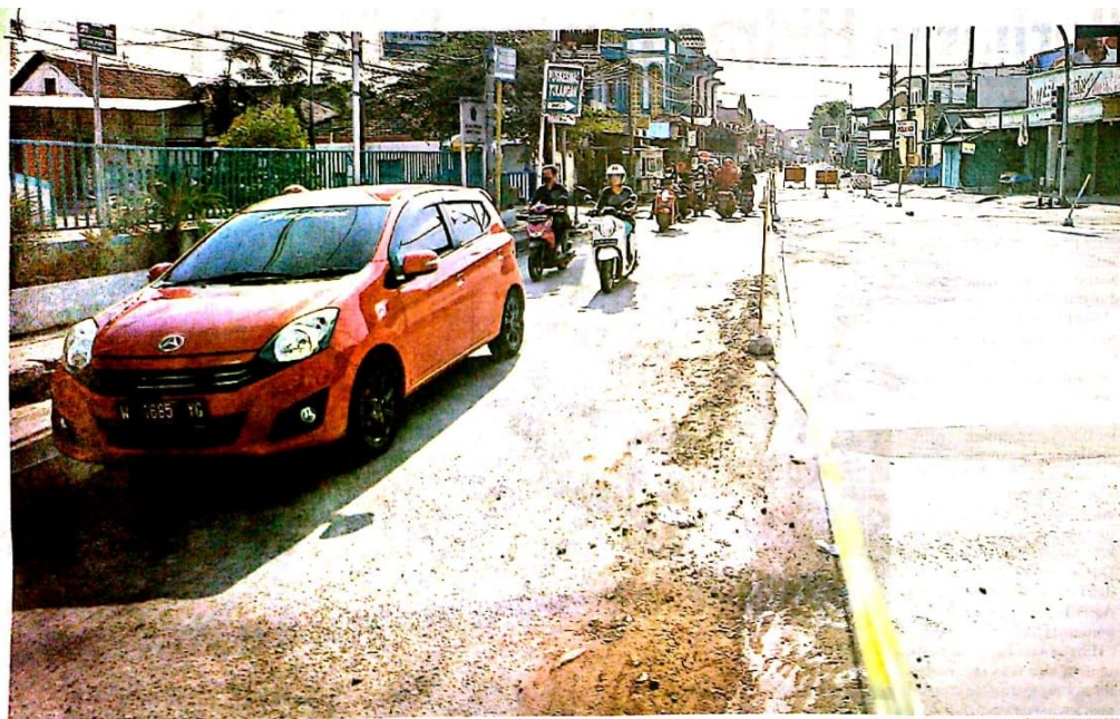
PEMBATASAN KENDARAAN: Pengguna jalan melintas di Jalan Raya Tulangan yang masih dalam proses betonisasi kemarin. Kendaraan berat dilarang lewat.

Selain karena kendaraan besar, ternyata ada pemotor yang nekat naik ke jalan yang sedang dikerjakan tersebut. (uzi/c19/amy)