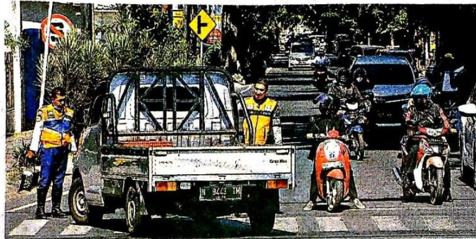
UNTUK URAI KEMACETAN: Petugas dinas perhubungan melakukan sosialisasi perubahan arus lalu lintas di Jalan Untung Suropati kemarin (13/9).

"Masih ada satu-dua yang tidak tahu. Kami sosialisasikan. Seminggu ke depan, kami masih atur di sana," jelas Plt Kasidalops Dishub Sidoarjo Novianto Koesno.