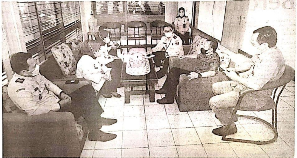
SINERGI: Kemeritumham Jatim saat menyambangi Komisi Informasi untuk bersinergi memberikan pelayanan informasi yang cepat, mudah dan berbiaya rendah.

SIDOARJO - Kanwil Kemeritumham Jatim berkomitmen untuk memberikan layanan kepada masyarakat guna memenuhi kebutuhan informasi publik. Salah satu upaya nyata adalah dengan menggandeng Komisi Informasi (KI) Provinsi Jatim dalam menjalankan tugas dan fungsi.