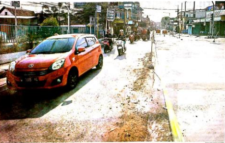
Truk Besar Dilarang Melintasi Raya Tulangan

Dalam SE Bupati tahun 2022 ini, kata Naim, ada perubahan dari SE Bupati Sidoarjo sebelumnya. Pada tahun 2022 ini, Misalnya ASN yang tadinya kena potong infraq dan sodakoh yang nilainya Rp5.000 menjadi Rp7.000. Sedangkan yang tadinya Rp7.000 menjadi Rp10.000. [kus.ca]