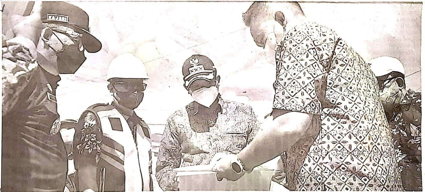
DIKEBUT: Bupati Sidoarjo Ahmad Muhdlor (tengah) meninjau proyek betonisasi jalan dari Simpang 3 Tulangan-Bulang, Selasa (13/9).

DEWAN PERWAKILAN RAKYAT SIDOARJO KABUPATEN SIDOARJO