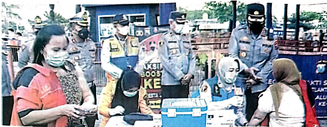
Kapolresta Sidoarjo Kombespol Kusumo Wahyu Bintoro meninjau vaksinasi booster serta membagikan bansos ke masyarakat.

DEWAN PERWAKILAN RAKYAT SIDOARJO KABUPATEN SIDOARJO