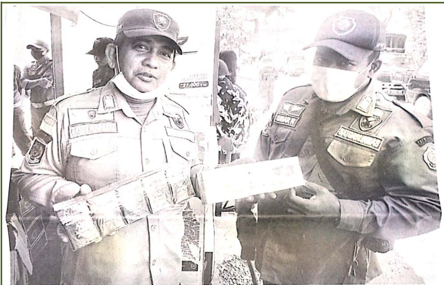
Petugas Satpol PP Sidoarjo menunjukkan rokok ilegal hasil sitaan di Desa Pagerewojo Kec Buduran.