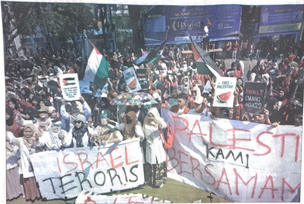
SOLIDARITAS: Ribuan mahasiswa Umsida gelar aksi bela Palestina.

SIDOARJO-Ribuan mahasiswa Universitas Muhammadiyah (Umsida) menghelar aksi bela Palestina di halaman kampus di Jalan Majapahit, Selasa, 7 Mei 2024. Aksi tersebut digelar sebagai bentuk dukungan kepada rakyat Palestina. Selain itu aksi tersebut juga merupakan bentuk kecamatan terhadap Israel. Yang secara terus menerus menyerang masyarakat sipil Palestina. Rektor Umsida Hidayatullah mengatakan, aksi tersebut telah mendapatkan dukungan dari Pimpinan Pusat Muhammadiyah. Termasuk di dalamnya Majelis Dikti Litbang PP Muhammadiyah. "Kami semua mengetahui bahwa penjajahan rakyat Palestina oleh Israel telah berlangsung hampir satu abad, yang sampai sekarang belum ada tanda-tanda selesai dengan wujud kemerdekaan," ucapnya saat ditemui selepas kegiatan. Karena itu sebagai wujud empati dan kebersamaan. Seluruh lembaga pendidikan Muhammadiyah di Indonesia lakukan aksi bela Palestina secara serentak. Aksi besar tersebut dilakukan karena pihaknya ingin memberikan pesan jika penjajahan di atas dunia harus dihapuskan. Karena tidak sesuai dengan pri kemanusiaan dan pri keadilan. "Itu persis dengan pernyataan konstitusi kita pada pembukaan Undang-Undang 1945 alinea pertama," ujarnya. "Kami ingin aksi bela Palestina ini didengar oleh dunia, didengar oleh PBB karena semua aksi nanti akan dikirim ke Internasional," imbuhnya.