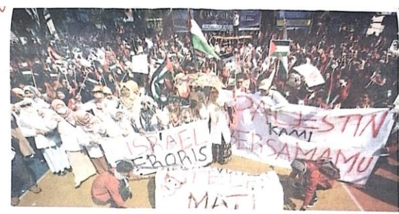
AKSI KEPRIHATINAN: Ratusan mahasiswa dari Universitas Muhammadiyah Sidoarjo menggelar aksi mendukung Palestina di halaman Kampus 1 Umsida kemarin (7/5).