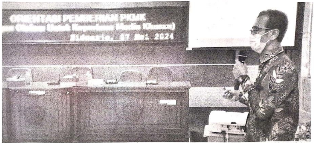
Petugas Dinkes Sidoarjo memaparkan kepada dokter anak di RS dan ahli gizi di Puskesmas, untuk program pemberian makanan tambahan mencegah kasus stunting di Sidoarjo.

mas mendapat pesan, dalam pemberian makanan tambahan, supaya mengutamakan Balita yang berasal dari keluarga miskin. Balita mereka men-