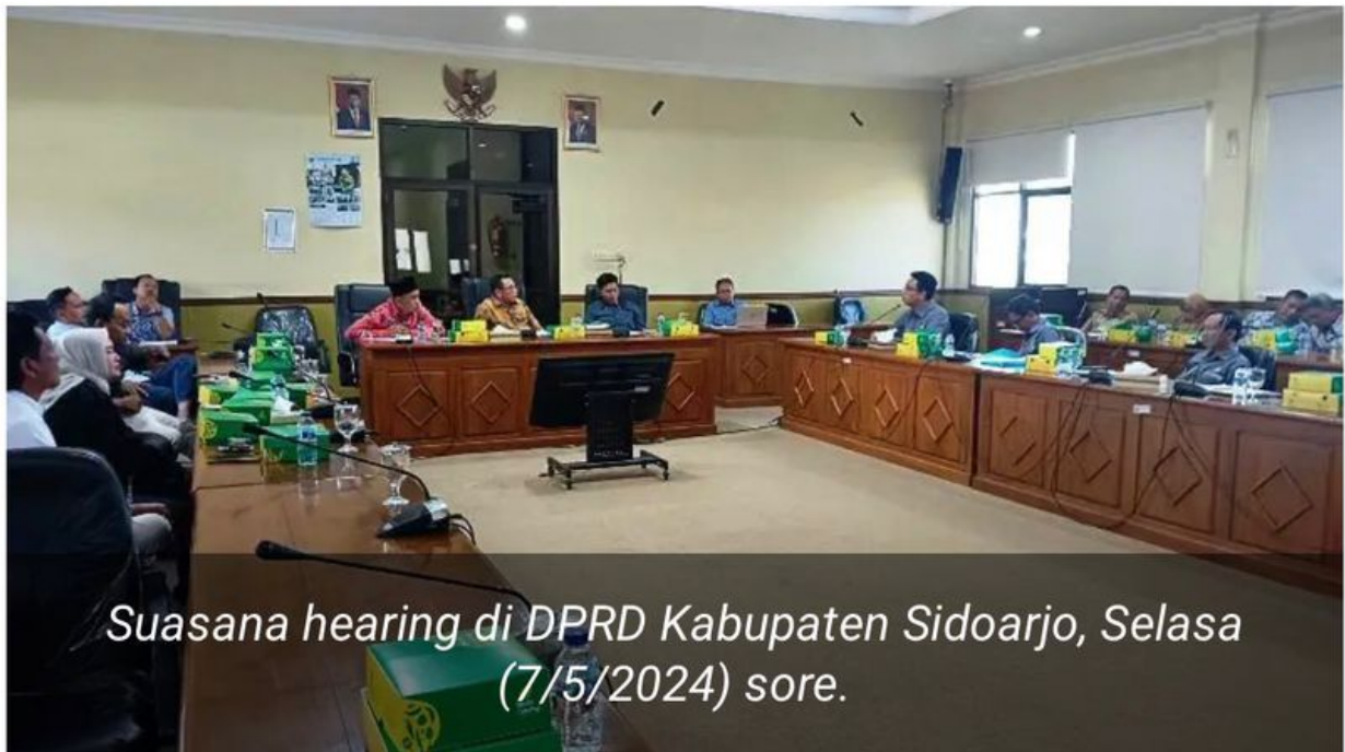
Suasana hearing di DPRD Kabupaten Sidoarjo, Selasa (7/5/2024) sore.

SIDOARJO (wartadigital.id) – Komisi B Bidang Ekonomi dan Keuangan DPRD Kabupaten Sidoarjo menanggapi keluhan masyarakat akan kualitas air dari Perumda Delta Tirta yang keruh dan berbau. Keluhan masyarakat akan kualitas air Perumda Delta Tirta sudah berlangsung lebih dari satu minggu.