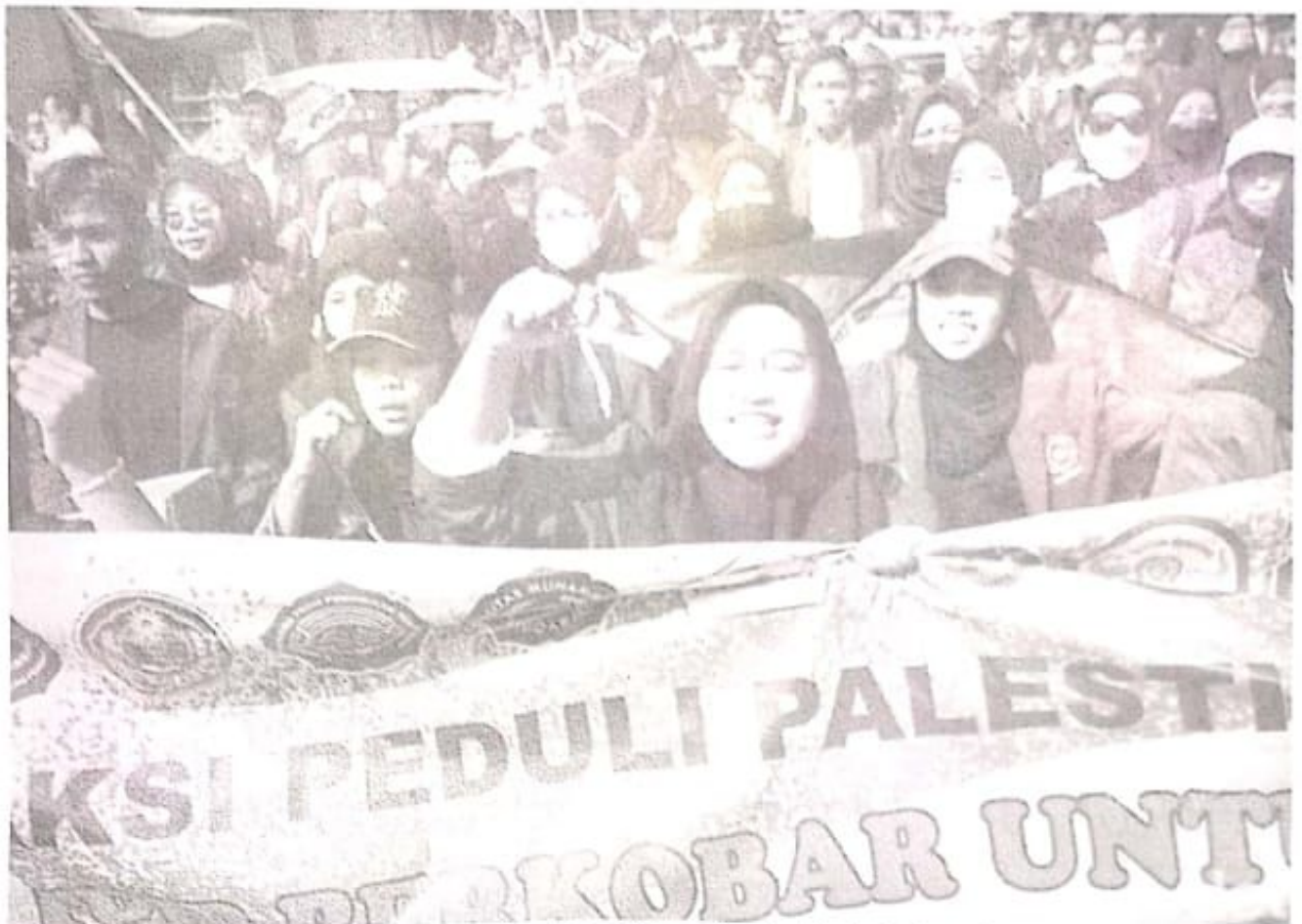
Mahasiswa dan warga Muhammadiyah se-Sidoarjo aksi bela Palestina.