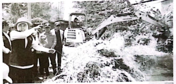
Gubernur Jawa Timur Khofifah Indar Parawansa bersih bersih sungai di Gedangan, Sidoarjo, Kamis (2/11/23).

Mantan menteri sosial ini juga menyampaikan, mitigasi dan kesiapsiagaan bencana ini dilakukan secara kolaboratif sebanyak