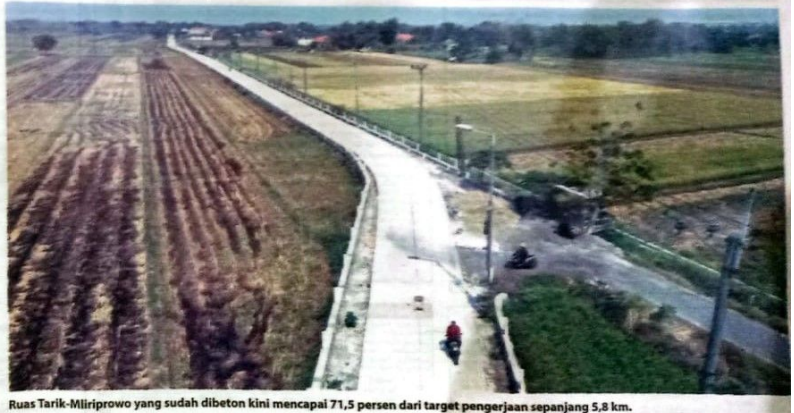
Ruas Tarik-Mliriprowo yang sudah dibeton kini mencapai 71,5 persen dari target pengerjaan sepanjang 5,8 km.

pir 5 km jalan yang sudah dicor. Dimulai dari barat ke timur yaitu dari Desa Mliriprowo ke Desa Tarik. Jalan beton tersebut sudah sampai Desa Singogalih. Selebihnya, masih tahap lean concrete (LC) di sebagian Singogalih dan Tarik. "Rigid (pengerasan beton) ini sudah hampir 5 km, kalau LC-nya sudah 100 persen, tinggal pelaksanaan rigid -nya saja," ujarnya. (kri/jok/epe)