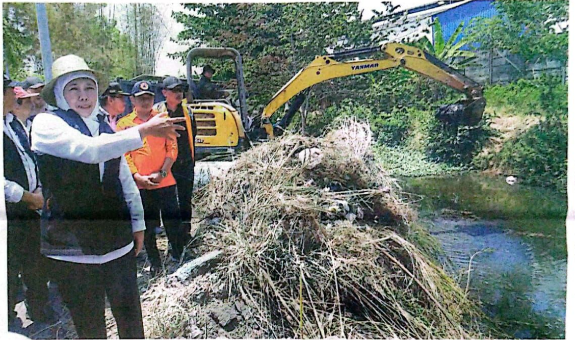
MENYAMBUT MUSIM HUJAN: Gubernur Jawa Timur Khofifah Indar Parawansa mengawasi pembersihan afvoer Jomblong, Gedangan, kemarin (2/11).

Apalagi, menurutnya, dalam waktu dekat mulai masuk musim hujan. Khofifah menyebut BMKG memprediksi awal hujan dimulai pada