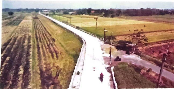
PASTI TUNTAS: Proyek pembangunan jalan beton di ruas Jalan Tarik-Mliriprowo yang sudah hampir selesai.

KOTA-Proyek betonisasi jalan Tarik-Mliriprowo mencapai progres yang mengesankan. Hingga pekan ke empat Oktober, progres proyek tersebut sudah mencapai 71,5 persen. Angka itu lebih tinggi dibandingkan target semula yang ditetapkan sebesar 47,1 persen. Kelebihan pengerjaan sebesar 24,4 persen menjadi bukti kemajuan yang melebihi ekspektasi.