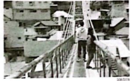
JADI PERHATIAN Wisatawan menikmati keindahan karung warna-warni dari jembatan kaca kemarin.