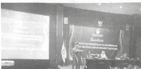
Giat Sosialisasi KPU Kabupaten Sidoarjo tentang calon bupati Sidoarjo dari jalur independen.

Sidoarjo, Pojok Kiri Sosialisasi calon Bupati Sidoarjo dari unsur independen di lakukan oleh komisioner KPU Sidoarjo di hotel Luminor, Jumat/ 3/5/24. Sedangkan untuk maju menjadi calon bupati independen harus punya dukungan massa 75 ribu dan dibuktikan dengan KTP serta bukti surat dukungan masyarakat. Sedangkan nantinya diharuskan men upload melalui Silon pada jadwal yang ditentukan nanti saat verifikasi administrasi. Katanya, Informasi ini disampaikan Komisi Pemilihan Umum Kabupaten Sidoarjo, saat