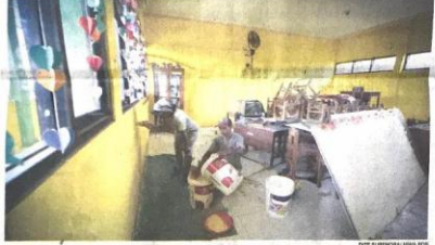
FINISHING: Pekerja menyelesaikan perbaikan gedung sekolah di lantai 2 SDN Sumput yang sempat rusak terkena puting belulang kemarin.

sedikitnya warga dari 10 kecamatan yang bisa memberikan dukungan untuk calon perseorangan," jelas Ana lagi. Masih menurut Ana, meskipun sampai hari ini belum Ada PKPU pendaftaran Pilkada yang diterima KPU Sidoarjo, namun pihaknya memang sudah harus melakukan sosialisasi. "Hal ini bertujuan, agar siapapun yang ingin maju melalui jalur perseorangan, memiliki waktu yang cukup untuk persiapan diri. KPU tetap memberikan ruang dan waktu untuk para pendaftar jalur independen sesuai koridor PKPU," Ucapnya. (Khol/Dy)