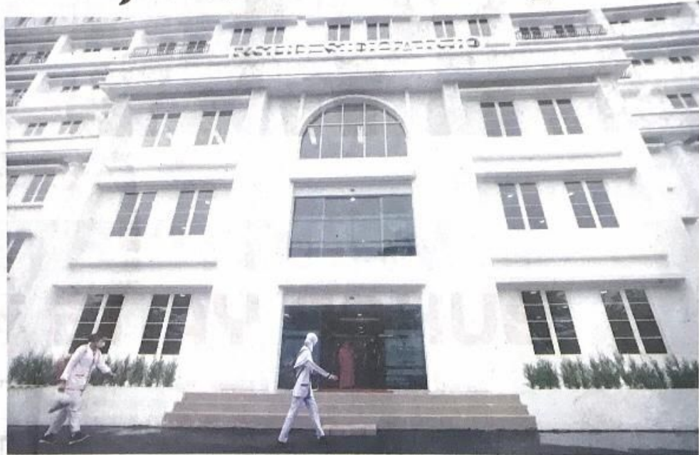
MENUNGGU LELANG: Suasana gedung RSUD R.T. Notopuro Sidoarjo kemarin. Pembangunan tahap kedua GPT segera dimulai.

"Ada farmasi dan laboratorium yang dipindah sementara karena bangunannya mau dibongkar," katanya. Selain itu, pelayanan rehab medis, pediatri, bedah digestif, urologi, hingga pediatri dapat dilayani di GPT