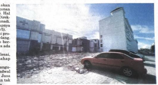
DIKEBUT: Rencana lokasi pembangunan Gedung Pusat Terpadu (GPT) tahap dua.

KOTA-RSUD RT Notopuro akan kembali melanjutkan pembangunan Gedung Pusat Terpadu (GPT). Hal tersebut disampaikan oleh Plt Direktur RSUD Sidoarjo, Syamsu Rahmadi. "Insyaallah segera dilanjut," ucapnya pada Radar Sidoarjo, Minggu (5/5). Syamsu menjelaskan, saat ini proyek ini masih dalam proses lelang. "Ini proses lelang masih terus berjalan, sebentar lagi akan segera ada pemenang lelang," ujarnya. Jika proses lelang sudah selesai, maka pembangunan GPT tahap kedua akan segera dilakukan. Syamsu menjelaskan, pembangunan dilakukan sesuai dengan jadwal dari Pengadaan Barang dan Jasa (PBJ). Karenanya pembangunan tak lama lagi akan segera dilakukan.