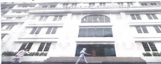
RSUD R.C. Notopuro.

Saat Ini Masuk Tahap Lelang SIDOARJO - Setelah selesai dan diresmikan pada akhir Januari lalu, Gedung Pelayanan Terpadu (GPT) RSUD R.C. Notopuro masuk tahap pembangunan selanjutnya. Yakni, kelengkapan interior dan fasilitas di lantai 4 hingga 7. Plt Direktur RSUD R.C. Notopuro di Syamsu Rahmadi mengungkapkan, proyek tersebut masih masuk pelaksanaan. "Insya Allah segera dilaksanakan tahun ini. Kita masih tunggu pemenang lelang nanti," tuturnya saat dikonfirmasi kemarin (5/5). Sebenarnya GPT RSUD R.C. Notopuro mulai dibangun Februari lalu selepas diresmikan Menteri Kesehatan Hariawan Sadikin. Lantai hingga 3 sudah digunakan untuk pelayanan. "Ada farmasi dan laboratorium yang dipindah sementara karena bangunan baru mau dibangun," katanya. Selain itu, pelayanan rehab medik, pediat, bedah digestif, urologi, hingga pediatri dapat dilayani di GPT.