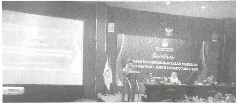
Giat Sosialisasi KPU Kabupaten Sidoarjo tentang calon bupati Sidoarjo dari jalur independen.

Informasi ini disampaikan Komisi Pemilihan Umum Kabupaten Sidoarjo, saat