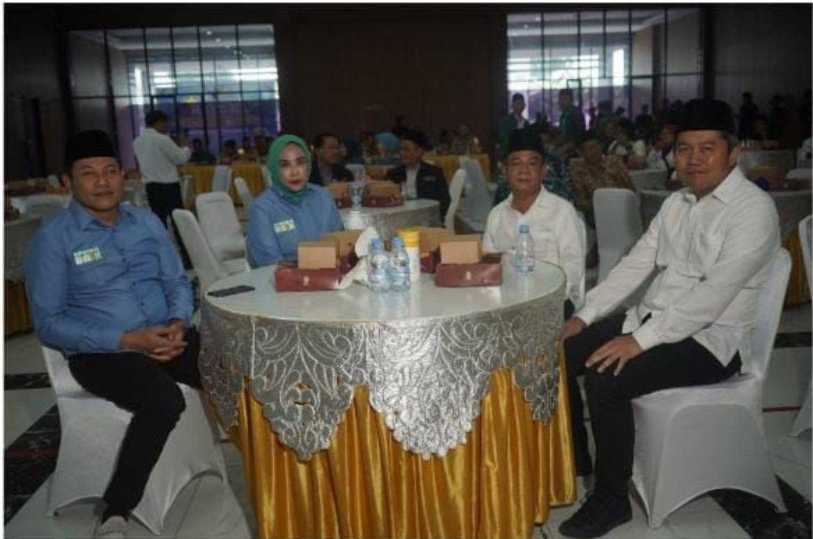
Paslon BAIK dan SAE duduk satu meja

sambutannya menegaskan pentingnya peran kepolisian dalam menjaga keamanan dan ketertiban selama Pilkada 2024. Ia menegaskan bahwa Polri memiliki amanah dari presiden untuk mendukung suksesnya agenda nasional Pilkada serentak.