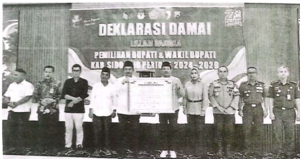
KOMITMEN: Dua Paslon Cabup dan Cawabup Sidoarjo hadir deklarasi damai di Polresta Sidoarjo, Kamis (7/11).

KOTA-Polresta Sidoarjo menggelar deklarasi damai Pilkada serentak 2024 di Gedung Serbaguna Mako Polresta Sidoarjo, Kamis (7/11). Deklarasi damai yang dilakukan merupakan bentuk komitmen bersama untuk menciptakan situasi yang aman dan kondusif menjelang Pilkada 2024.