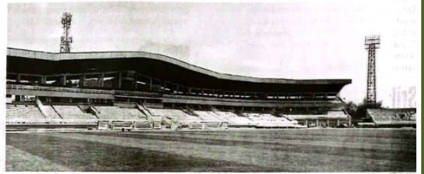
LAVAK: Stadion Gelora Delta Sidoarjo usai renovasi.

jadi kabar gembira bagi pendukung Deltras Sidoarjo, Deltamania. Ke-