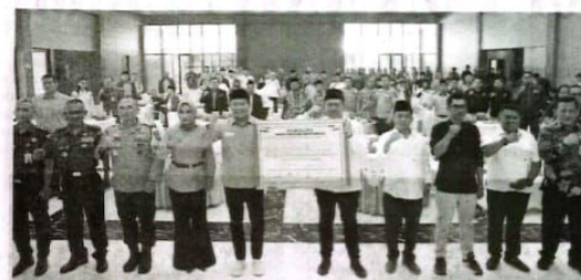
Deklarasi pilkada damai di Mapolresta Sidoarjo yang diikuti seluruh pasangan calon, perwakilan KPU, dan Bawaslu.

Selain itu, siap untuk tidak saling menyebarkan isu SARA, politik identitas, hoaks, dan provokasi, serta siap bersama-sama TNI-Polri mewujudkan situasi kamtibmas dengan