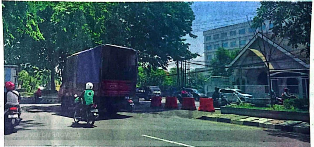
DITUTUP : Kondisi terkini putar balik di Raya Waru, Kamis (7/11).

Menurut AKP Jauhar, utamanya banyak masyarakat yang mengeluhkan bahwa U-turn Waru menjadi biang