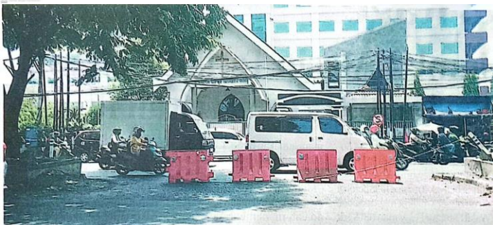
NEKAT: Empat buah papan pembatas dipakai untuk menutup U-turn di Jalan Jenderal S. Parman sejak kemarin (7/11).

para ulama agar Sidoarjo diselimiti kebaikan. "Semoga apa yang dipesankan oleh para ulama bisa kami amalkan," ujarnya. (uzi/ris)