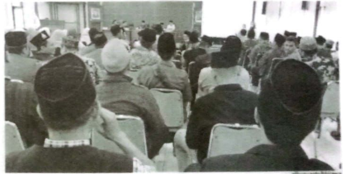
para santri dari MWC NU di Kabupaten Sidoarjo, diundang dalam technical meeting persiapan Carnival Santri Nusantara di Kota Sidoarjo.

ini, akan berkeliling di dalam kota Sidoarjo. Start dari paseban alun-alun Sidoarjo, juga finish di paseban alun-alun Sidoarjo. [kus.ina]