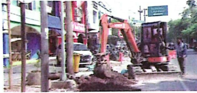
Alat berat dikerahkan untuk mempercantik Pasar Larangan.

Karena itu, dilakukan penataan. Pertama merelokasi ratusan pedagang yang dipindah ke sebelah barat pasar karena lebih representatif. Agar tampak luas, pagar depan toko sebelah sisi timur pasar dibongkar. Untuk menambah estetika dan membuat pengunjung pasar merasa nyaman maka dibangun taman. Dan nantinya tempat parkir lebih tertata.