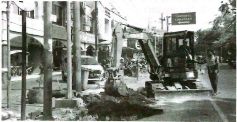
Revitalisasi pasar Larangan Kamis(9/11/23)