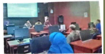
PURNA: Kegiatan penyerahan SK Pensiun ASN yang pensiun per Desember 2023, Kamis (9/11).

KOTA-Badan Kepegawaian Daerah (BKD) Sidoarjo mengumumkan ada 680 Aparatur Sipil Negara (ASN) di wilayah tersebut akan memasuki masa pensiun pada tahun ini. Dari jumlah tersebut, 41 ASN di antaranya akan memasuki masa purna tugas per 1 Desember mendatang.