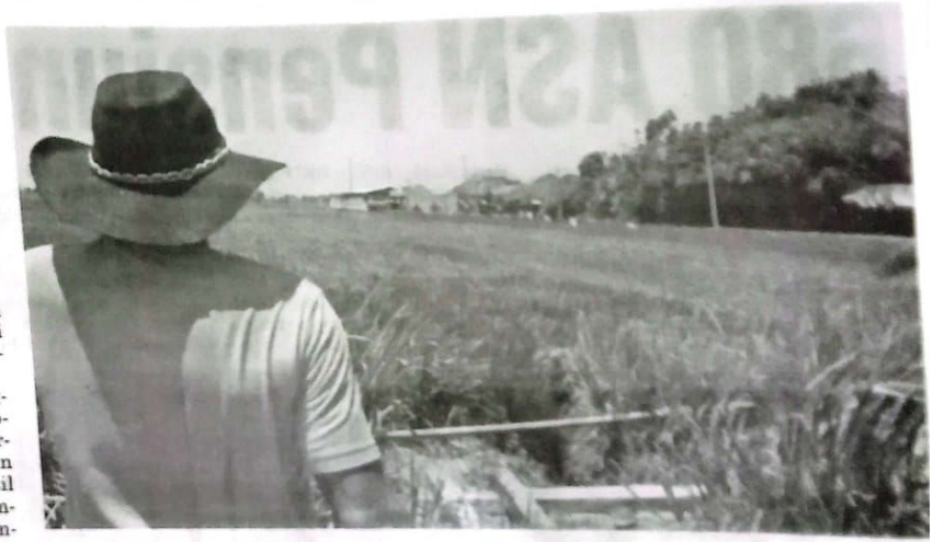
SUBUR: Seorang petani sedang menyemprotkan pupuk pada tanaman padi.

Eni menekankan pentingnya penggunaan pupuk subsidi sesuai aturan yang berlaku. Agar dapat memberikan manfaat optimal bagi hasil pertanian. Sambil tetap memperhatikan aspek keberlanjutan lingkungan. (nis/vga)