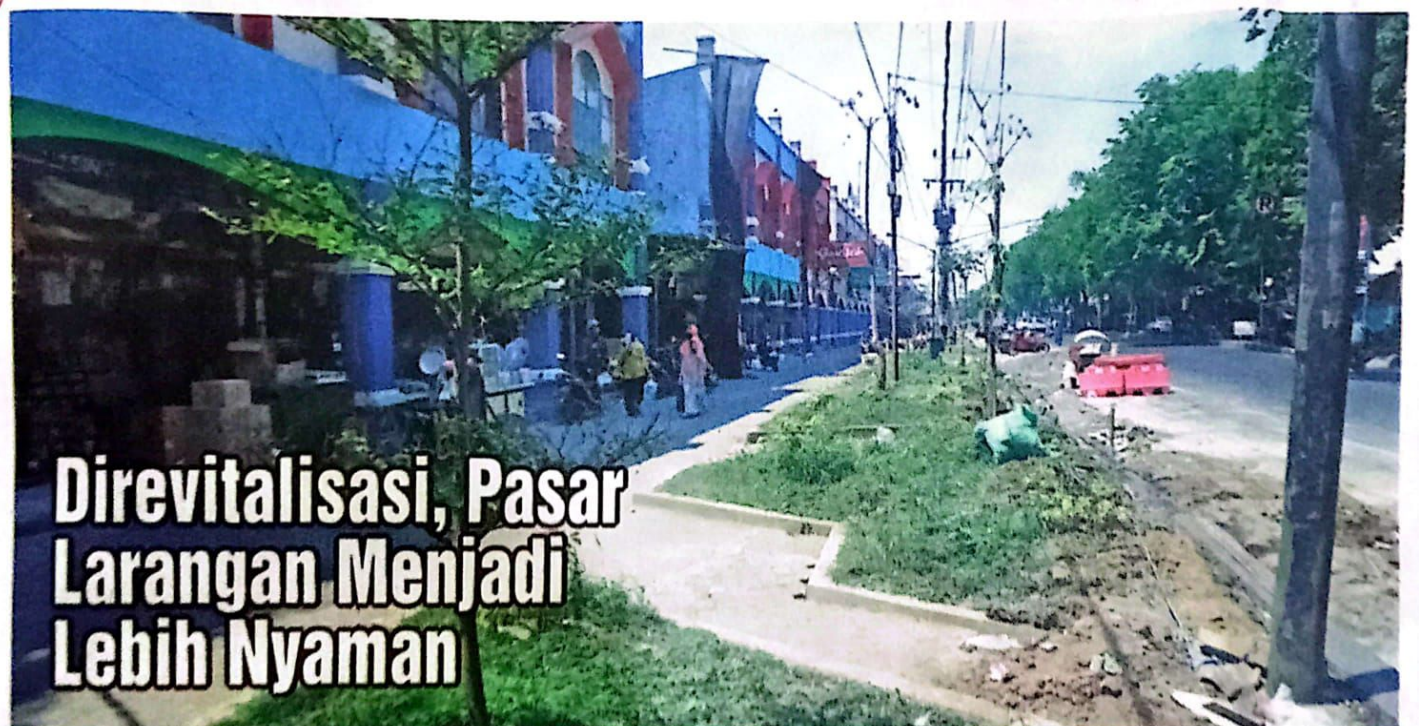
BERSIH: Kondisi Pasar Larangan yang masih tahap revitalisasi.

KOTA-Pasar Larangan, Kecamatan Candi sedang dilakukan revitalisasi oleh Dinas Perindustrian dan Perdagangan Sidoarjo. Pasalnya, pasar tradisional yang lokasinya tidak jauh dari pusat kota Sidoarjo itu sudah