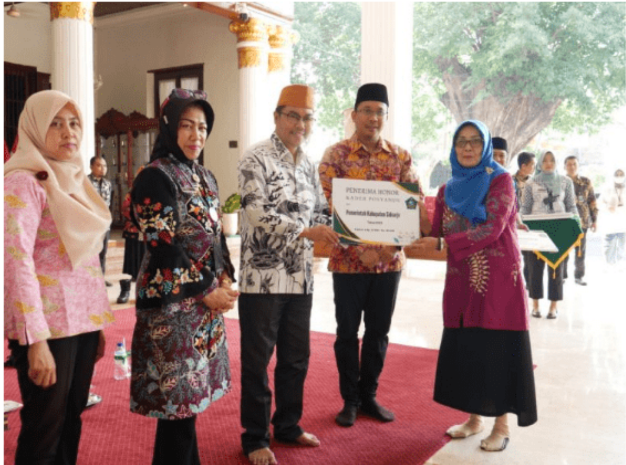
Pemberian insentif dan honor untuk tenaga kesehatan dan posyandu di Pendopo Delta Wibawa