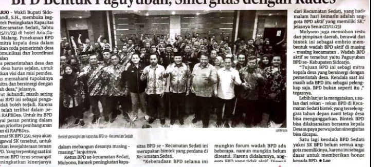
Benteng paguyuban BPD se-Kecamatan Sedati dalam membangun desanya masing-masing.