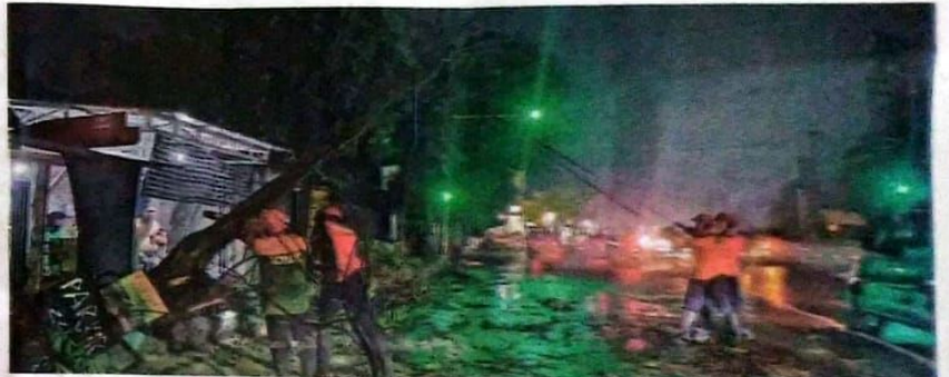
POHON LAPUK : Kondisi pohon tumbang menutup akses Jalan Rava Prambon.