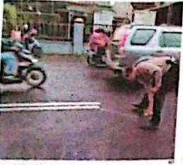
OLAH TPK: Lokaal kecelakaan di Krian. Korban tewas di TKP.