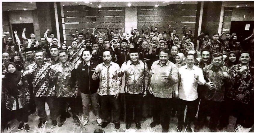
Bimtek peningkatan kapasitas BPD se- Kecamatan Sedati

"Mengetai SK BPD 350, saya akan turut mengawal SK tersebut, untuk meningkatkan kesejahteraan teman-teman BPD. Yang terpenting saat ini teman-teman BPD terus semangat untuk meningkatkan kinerjanya