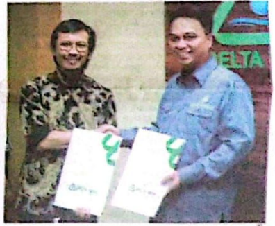
KERJA SAMA: MoU dengan PT Adya Tirta Batam (ATB) dalam rangka menurunkan serapan umbulan TKA