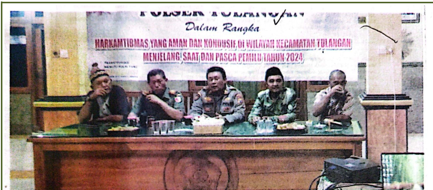
Forkopimcam Tulangan menggelar Curhat Kamtibmas di Balai Desa Singopadu, Tulangan, Sidoarjo.

DEWAN PERWAKILAN RAKYAT DAERAH KABUPATEN SIDOARJO