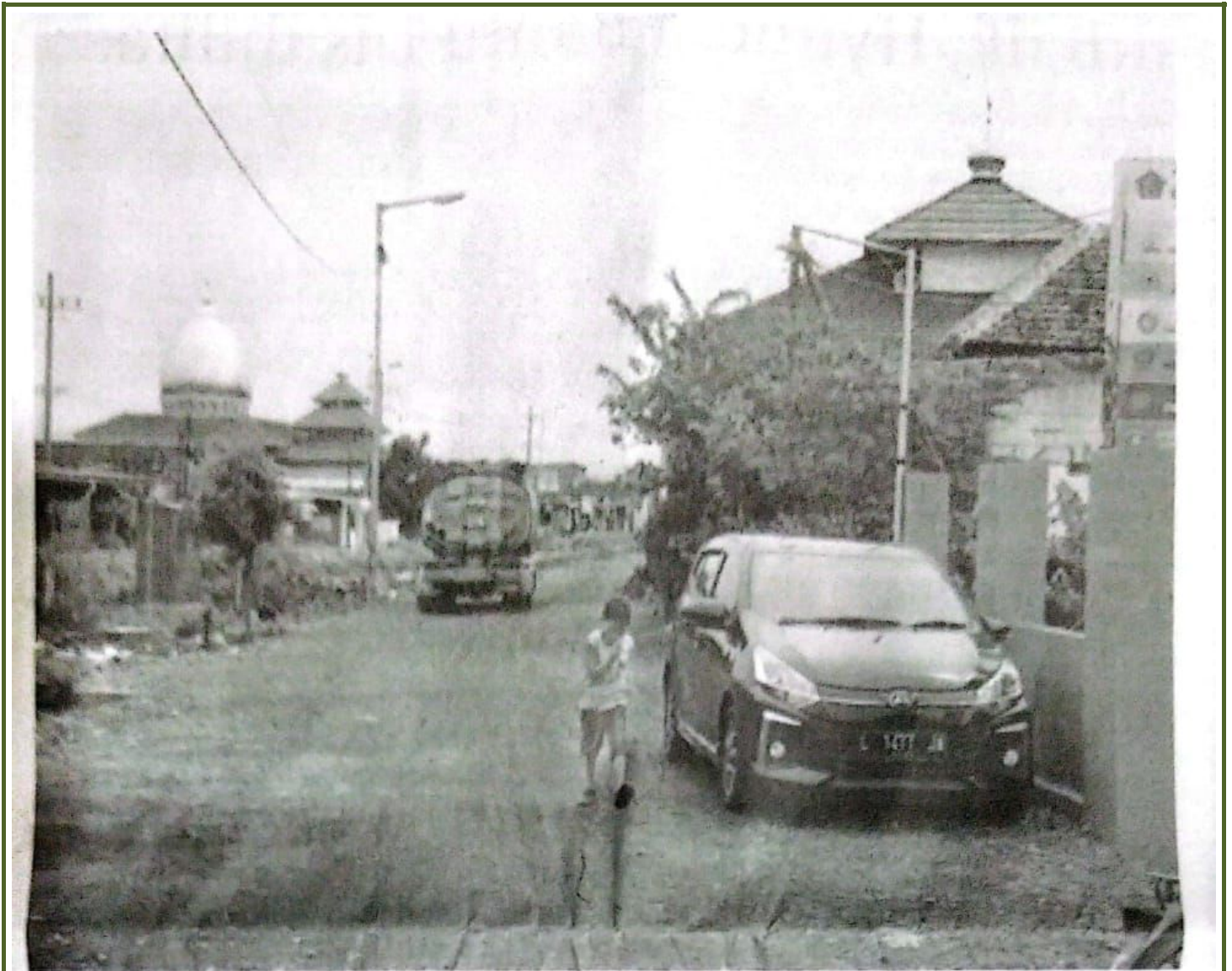
Jalan Desa Banjarasri yang kerap banjir bakal dibeton tahun ini.

DEWAN PERWAKILAN RAKYAT DAERAH KABUPATEN SIDOARJO