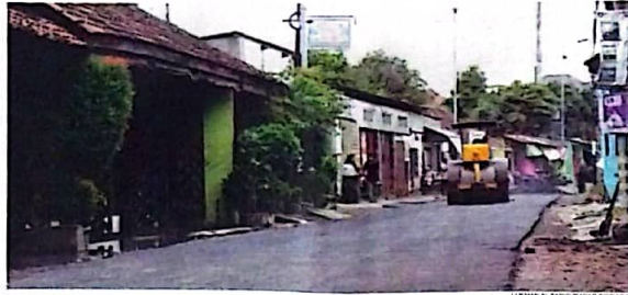
MULUS: Pengerjaan perbaikan jalan rusak di Kureksari, Waru terus disebut.

pengerjaan tuntas, maka jalan itu dapat langsung digunakan. Sebab selama proses perbaikan, jalan ditutup sementara. "Bisa langsung dipakai kalau sudah selesai. Kan aspal bukan beton," imbuhnya.