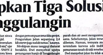
Banjir di Tanggulangin.

Masa Tanggap Daurat Berakhir SIDOARJO - Masa tanggap darurat telah berakhir. Tiga solusi yang akan diterapkan Pemkab Tanggulangin untuk mengatasi banjir di wilayah ini.