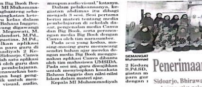
Pelatihan media pembelajaran berbasis teknologi.

TANGGULANGIN - Abad 21 adalah era di mana dunia penuh dengan inovasi. Guru sebagai pendidik harus mengikuti perkembangan ini. Salah satunya dengan menggunakan teknologi dalam pembelajaran. Salah satu upaya yang dilakukan Dinas Pendidikan dan Kebudayaan Kabupaten Tanggulangin adalah menggelar pelatihan media pembelajaran berbasis teknologi untuk guru-guru di wilayah ini.