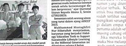
Siswa Smamita Sidoarjo borong medali emas dan perak.

Sidoarjo, Memo X Sejumlah siswa SMA Muhammadiyah 1 Taman (Smamita) Sidoarjo kembali meraih medali emas dan perak di ajang AISEEF (Asian Innovative Science Environment and Entrepreneur Fair) Tahun 2023 yang digelar di Universitas Diponegoro (Undip), Semarang, Jawa Tengah. Ajang prestasi tingkat Asia ini digelar secara daring pada tanggal 10 sampai 14 Februari 2023 kemarin.