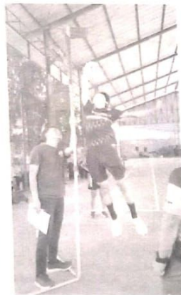
Sebanyak 348 atlet pelajar mengikuti PPDB SMANOR. Mereka juga menjalani tes seperti teknik, fisik hingga psikologi.

Ia berharap calon peserta didik yang nantinya diterima di SMANOR adalah mereka yang memiliki potensi untuk dikembangkan teknik dan kemampuan agar meraih prestasi di level nasional maupun internasional. [wvn.why]