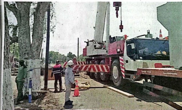
INFRASTRUKTUR: Proses pembangunan jembatan baru di Kedungpeluk mulai dilakukan.