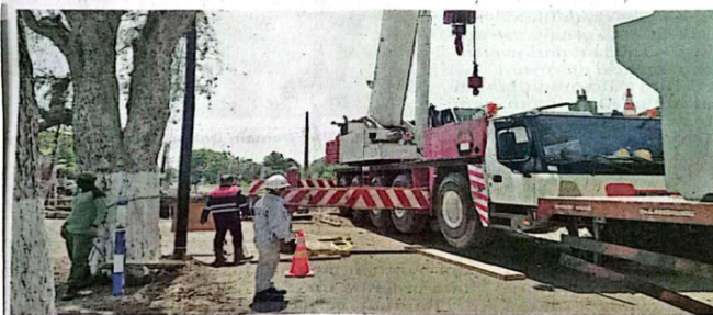
INFRASTRUKTUR: Proses pembangunan jembatan baru di Kedungpeluk mulai dilakukan.