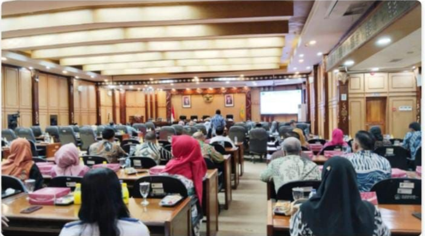
Suasana ruang sidang DPRD Kabupaten Sidoarjo pada Selasa, (8/10/2024)