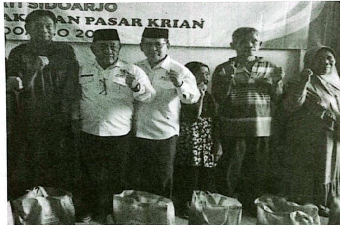
Kadisperindag Sidoarjo dan Pengurus Baznas Sidoarjo, menyerahkan Sembako kepada perwakilan pedagang pasar Krian.

Kebakaran yang terjadi di Pasar Krian beberapa waktu lalu, kata