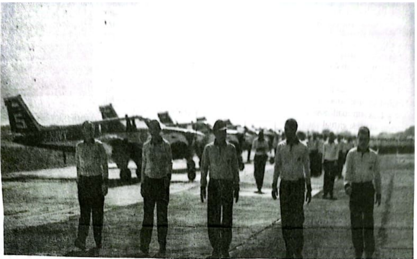
Danuspenerbal dan anggota TNI AL-Puspenerbal Selasa (8/10/24) senam bersama.