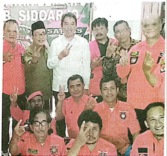
DOK TIM SAE

Dia menyebutkan, Sidoarjo memiliki potensi besar seiring keberadaan Bandara Internasional Juanda serta berbagai industri. "Kami ingin Sidoarjo menjadi etalase Indonesia yang ramah bagi semua warga, termasuk