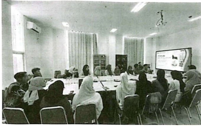
Focus group discussion series 1 yang diselenggarakan Prodi Administrasi Publik UMSIDA, kemarin.

"Smart city, mengutamakan pemanfaatan media informasi untuk