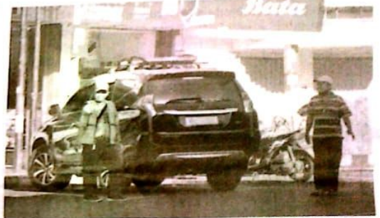
BELUM JELAS : Salah satu titik parkir di Jalan Gajah Mada Sidoarjo.

Dalam addendum juga bakal disusun apakah ketentuan besaran setoran parkir berlaku surut ataukah tidak. Karena saat PKS awal nilai setorannya sekitar Rp 32,09 miliar. Dengan asumsi 359 titik parkir. (son/vga)