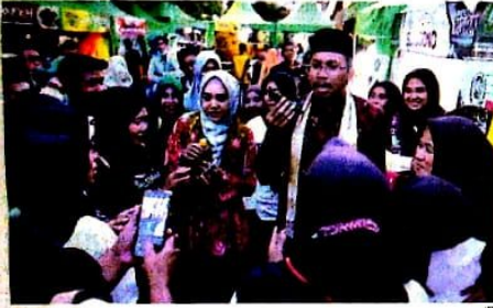
PRIORITAS: Bupati Sidoarjo Ahmad Muhdlor bersama Istri di sela launching program Kurma.

KOTA-Bupati Sidoarjo Ahmad Muhdlor terus mengevaluasi pelaksanaan 17 program prioritas khususnya yang berkaitan dengan ekonomi kreatif. Yang terbaru, yakni program Kurma (Kartu Usaha Perempuan Mandiri). Program berbasis usaha kelompok yang di dalamnya dikelola minimal lima orang dan maksimal 10 orang itu menjadi strategi Muhdlor dalam meningkatkan ekonomi kreatif di sektor perempuan. Total penerima program Kurma tahun ini sebanyak 1.891 kelompok. Bantuan modal yang diterima nilainya variatif mulai dari Rp 5 juta hingga Rp 50 juta. Bupati alumni Fisip Unair Su-