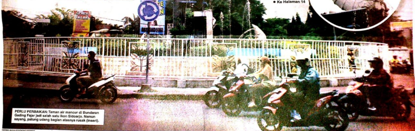
PERLU PERBAIKAN: Taman air mancur di Bundaran Gading Fajar jadi salah satu ikon Sidoarjo. Namun sayang, patung udang bagian atasnya rusak (insert).