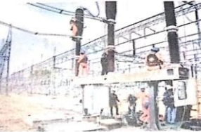
OPTIMAL: Tim PLN Unit JBM saat melakukan pembaruan material pada GITET 500 kV Krian sebagai upaya pelayanan optimal ke pelanggan.