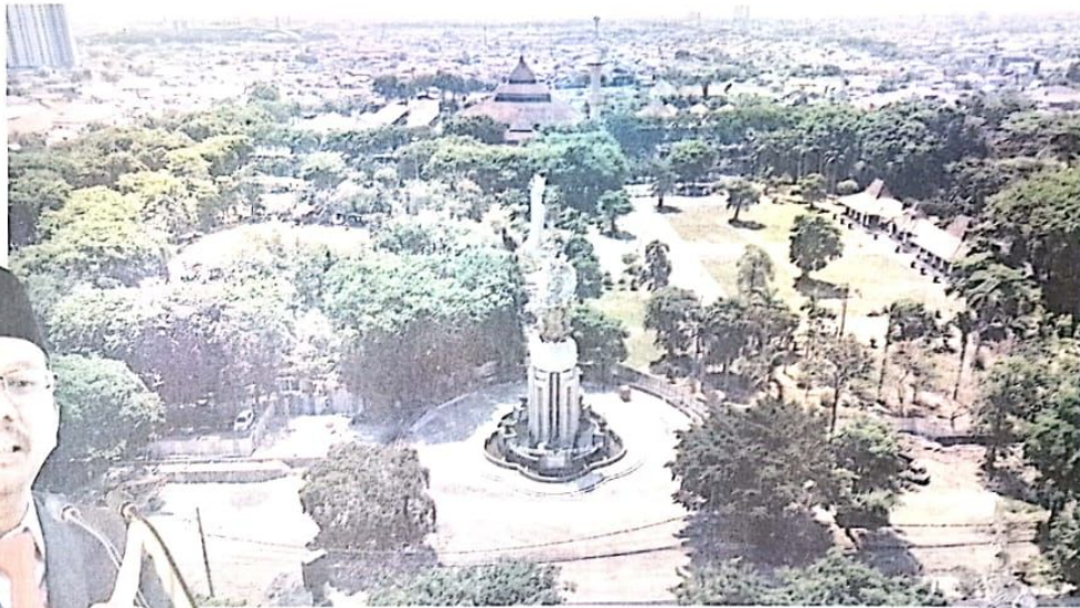
TAHAP Pengerjaan: Kondisi Alun-alun Sidoarjo yang sedang direvitalisasi.

Bupati yang akrab disapa Gus Muhdlor itu menjelaskan, langkah yang dilakukan