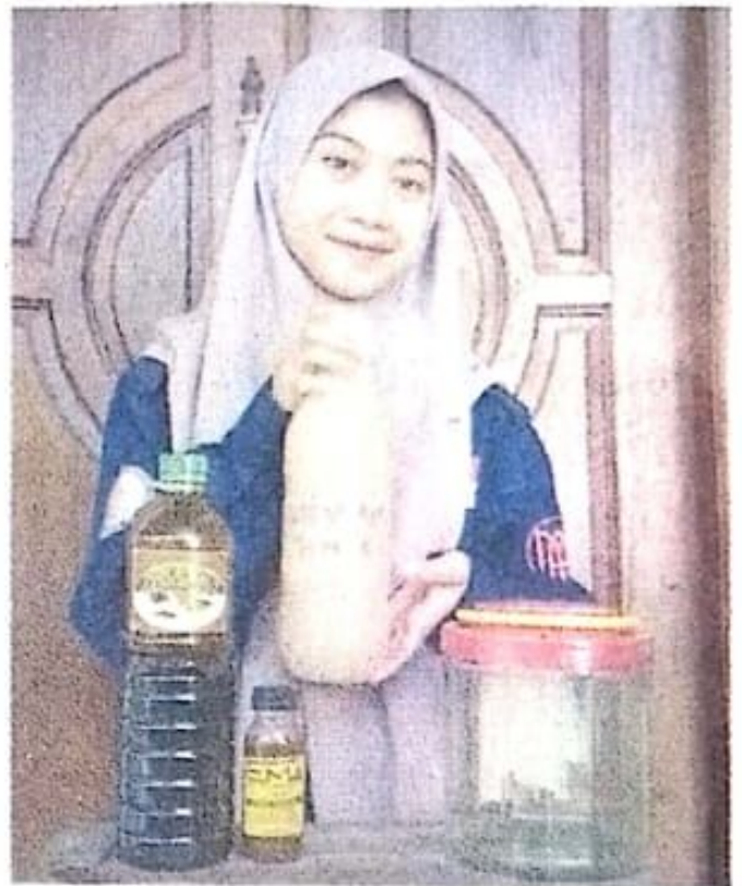
TIM PEMASARAN JAWA POS

Sayangnya, beberapa limbah dibuang begitu saja di sungai sehingga menimbulkan bau tidak sedap.