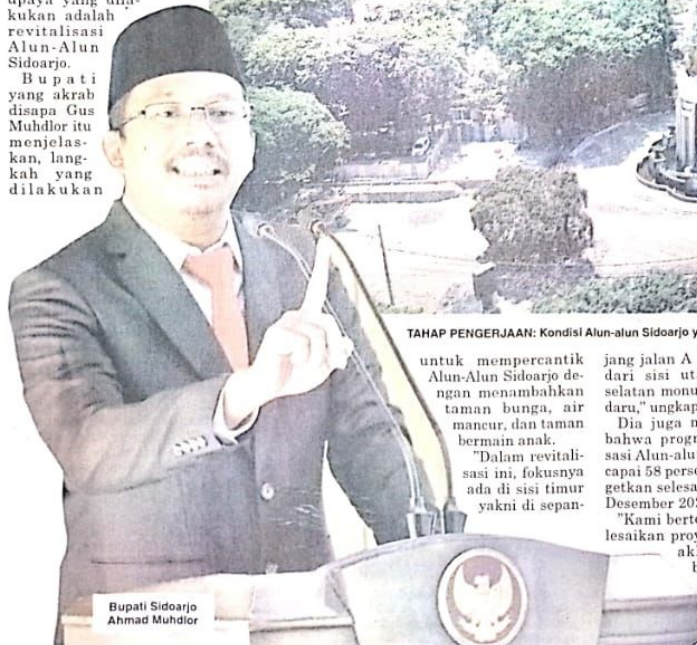
Bupati Sidoarjo Ahmad Muhdlor

untuk mempercantik Alun-Alun Sidoarjo dengan menambahkan taman bunga, air mancur, dan taman bermain anak.