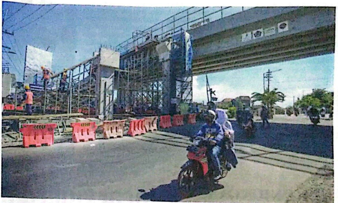
TAHAP AKHIR: Pekerja menyelesaikan pembangunan flyover Krjan kemarin (21/11). Pembangunan flyover Krian sudah masuk tahap finishing dan ditargetkan tuntas akhir Desember.