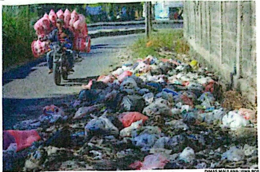
JOROK: Tumpukan sampah sepanjang 50 meter di jalan penghubung Krian dan bypass di Desa Punokawan, Krian, Sidoarjo, kemarin (21/11).

"Biasanya dibakar warga kalau pas sudah terlalu penuh. Bakarnya langsung di lokasi itu," ungkapnya. Menurutnya, bukan warga sekitar yang