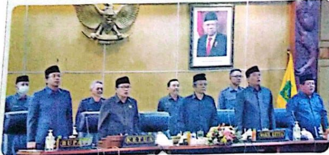
SINERGI: Suasana rapat paripurna saat membahas APBD 2023.

KOTA-Meski tahun anggaran masih berjalan, Angka Sisa Lebih Perhitungan Anggaran (Silpa) dalam APBD 2023 diperkirakan mencapai sekitar Rp 492 miliar. Kalangan legislatif pun menilai Pemkab perlu melakukan evaluasi terhadap beberapa program yang tidak bisa terlaksana tahun ini.