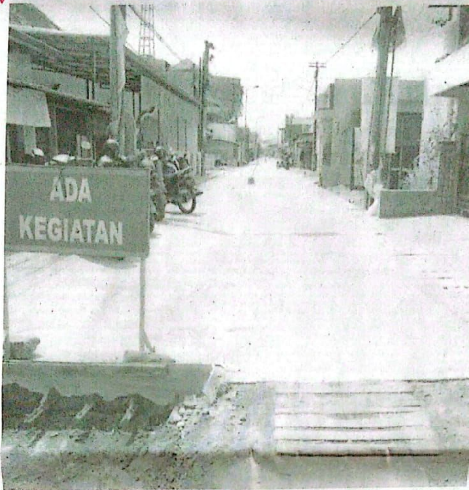
Proyek betonisasi di Jalan Tropodo 1, Waru Sidoarjo, Jawa Timur yang sudah rampung 95 persen siap dilewati kendaraan, untuk meningkatkan perekonomian warga setempat.