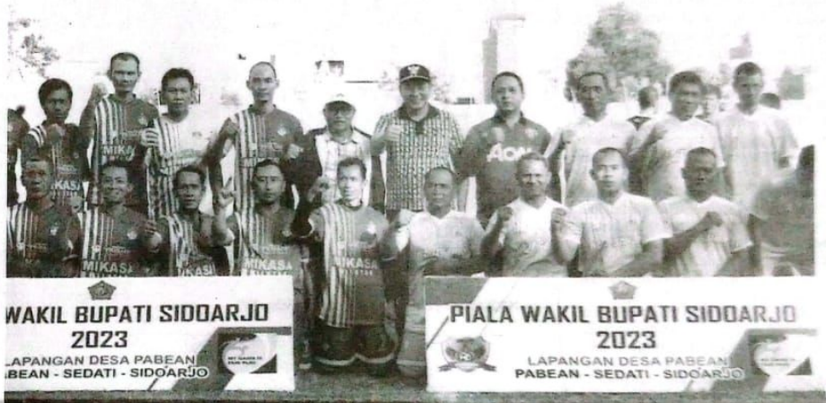
Pembukaan Turnamen sepak bola PSAP CUP

Lebih lanjut Rafi juga menjelaskan untuk selanjutnya akan dilakukan pembinaan - pembinaan. Agenda ini akan menjadi agenda rutin PSAB Pabean. ● Loe