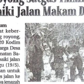
Satgas TMMD ke-120 Kodim 0816/Sidoarjo bersama warga Penambangan bergotong-royong memperbaiki jalan makam.

Sidoarjo, Memorandum Dalam semangat kebersamaan dan gotong royong, Satgas TMMD ke-120 Kodim 0816/Sidoarjo dan warga Desa Penambangan, Kecamatan Balongbendo memperbaiki jalan makam desa, Minggu (19/5). Kegiatan ini bertujuan untuk mempermudah akses jalan ke makam saat membawa jenazah maupun ketika warga berziarah. Perbaikan jalan ini dilakukan mengingat pentingnya akses yang memadai menuju makam, baik dalam kondisi darurat seperti prosesi pemakaman maupun untuk kegiatan ziarah rutin oleh warga. Kondisi jalan yang sebelumnya rusak dan sulit dilalui kini mulai diperbaiki dengan semangat gotong royong antara satgas TMMD dan warga setempat.