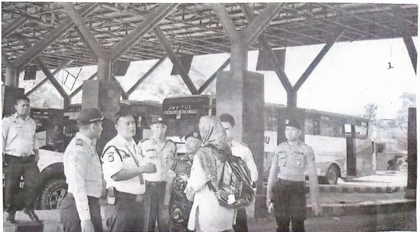
Detusan Gabungan saat melaksanakan pengamanan bus penumpang tujuan Bali

Di lokasi, Polisi juga menghibau kepada masyarakat untuk turut serta menjaga keamanan, ketertiban guna mensukseskan acara internasional World Water Forum (WWF) ke-10 yang digelar di Bali mulai 18-25 Mei 2024. (Khol/ Ben)