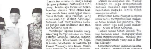
Wabup Sidoarjo menyerahkan bantuan pangan untuk lansia di Desa Dulu.

Lansia itu selama ini hanya hidup dengan mengandalkan bantuan makanan dan suplemen kesehatan. Kepala Desa Dulu, Wabup Sidoarjo menyerahkan bantuan pangan untuk lansia di Desa Dulu. Wabup Sidoarjo menyerahkan bantuan pangan untuk lansia di Desa Dulu. Bantuan tersebut berupa beras, minyak, dan telur. Wabup Sidoarjo menyerahkan bantuan pangan untuk lansia di Desa Dulu.