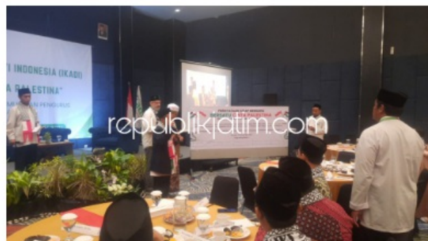
FANITA ZANG'AN - Seluruh peserta Seminar Bersatu Cinta Palestina menandatangani larar berjuang untuk Palestina yang digelar PD IKADI di Luminor Hotel Sidoarjo, Minggu (03/12/2023).

Sidoarjo (republikjatim.com) - Pengurus Daerah (PD) Ikatan Dai Indonesia (IKADI) menggelar acara Seminar dengan tema Bersatu Cinta Palestina, Minggu (03/12/2023). Dalam acara seminar menghadirkan tiga nara sumber itu digelar di Luminor Hotel, Sidoarjo.