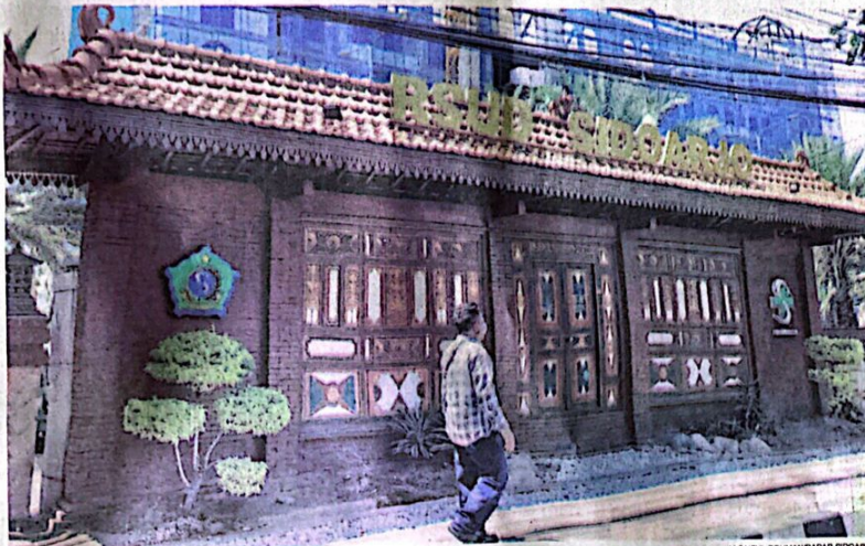
NAIK KELAS: RSUD Sidoarjo kini sudah menjadi tipe A.