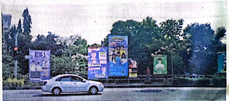
MULAI DIPASANG: Beberapa caleg yang sudah memasang APK di Sidoarjo.

KPU Sidoarjo juga mengatur larangan pemasangan alat peraga kampanye di beberapa lokasi. Seperti tempat ibadah, rumah sakit, tempat pendidikan, gedung pemerintah, fasilitas milik pemerintah, dan lokasi lain yang dapat mengganggu ketertiban umum.