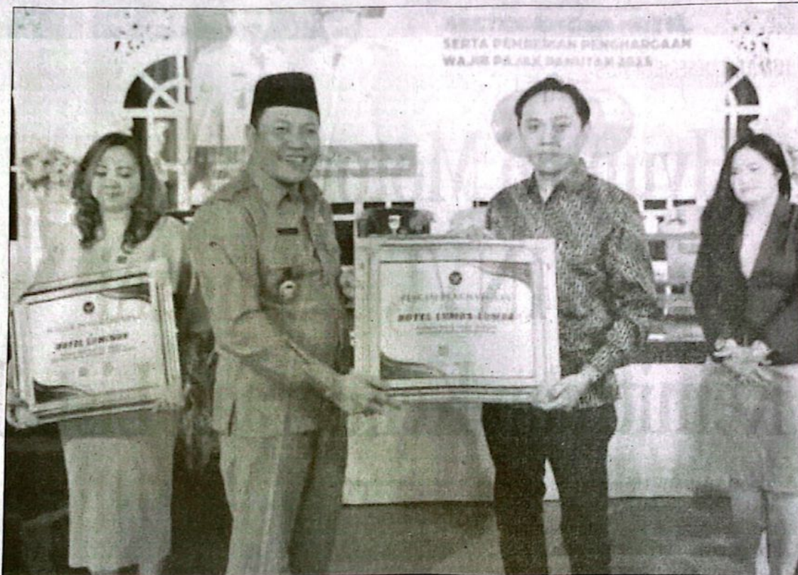
Wakil Bupati Sidoarjo Subandi