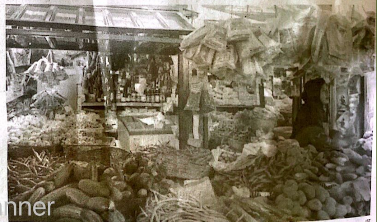
MULAI TURUN: Cabai merah yang dijual di Pasar Larangan, Sidoarjo.

Dalam situasi ini, konsumen dan pelaku usaha di sektor cabai perlu memantau perkembangan pasar dengan cermat untuk mengambil keputusan yang tepat. (nis/vga)