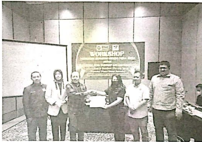
WORKSHOP - Badan Narkotika Nasional (BNN) Kabupaten Sidoarjo menggelar workshop penguatan kapasitas untuk insan media. Kegiatan ini, untuk mendukung kota tanggap ancaman Narkoba di Premier Place Hotel Juanda, Sidoarjo, Jumat (30/09/2022).

"Narkoba beresiko terjadinya pelemahan berbagai sisi kehidupan masyarakat yang akan menghancurkan generasi bangsa. Karena itu kita siapkan kegiatan ini agar Sidoarjo bisa menja-