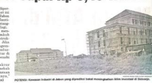
Progres pembangunan di salah satu lokasi investasi di Kabupaten Sidoarjo.