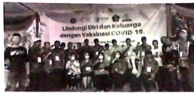
Vaksinasi massal 1000 dosis gratis di Klinik Pratama dr. Andre Yulius, Sabtu (1/10/22)