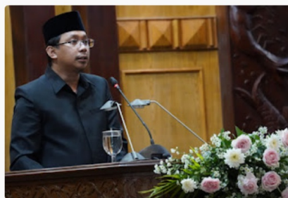
Bupati Sidoarjo, Ahmad Muhdlor.

Terkait hal itu, Bupati Sidoarjo, Ahmad Muhdlor yang ditemui sesuai rapat berjanji akan memperhatikan semua masukan yang disampaikan koleganya di lembaga legislatif tersebut.