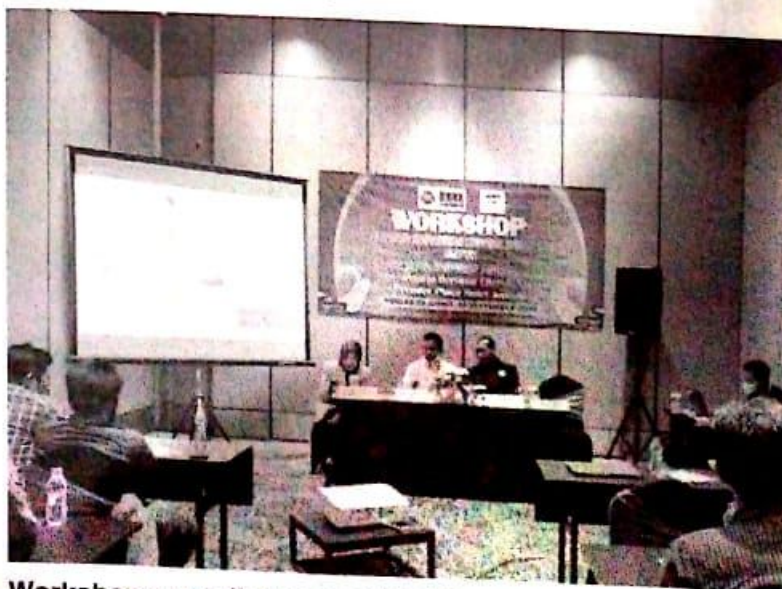
Workshop yang diadakan BNN Sidoarjo di Premiere Place Hotel, Juanda.

Terakhir, ia berpesan untuk selalu menjaga nama Sidoarjo dari narkoba. Selain untuk menekan angka peredaran narkoba, juga menjadi pencegah rusaknya generasi penerus bangsa kita dari narkoba. (cat/rd)