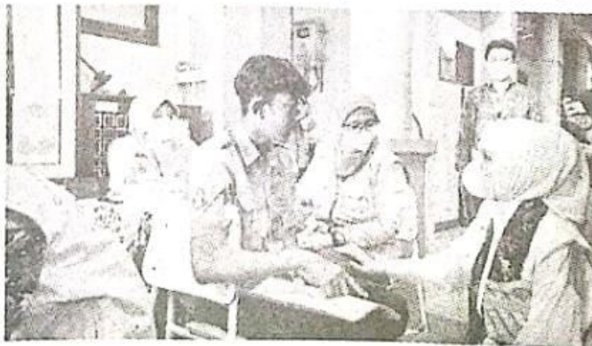
Arzeti berbincang dengan siswa SMK Plus NU Sidoarjo yang ikut vaksinasi booster.

"Anak-anak semua, bunda minta kalian jadi kepanjangan tangan pemerintah, mitra pendamping untuk memutus mata rantai Covid-19. Salah satunya dengan vaksinasi booster," harap politisi asal Partai Kebangkitan Bangsa (PKB) ini. (sta/rd)