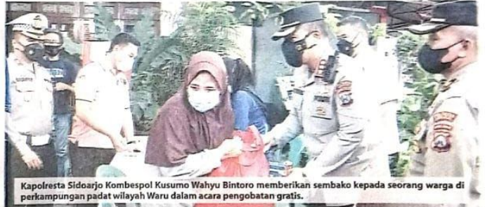
Kapolresta Sidoarjo Kombespol Kusumo Wahyu Bintoro memberikan sembako kepada seorang warga di perkampungan padat wilayah Waru dalam acara pengobatan gratis.

Dalam kesempatan itu, pihak Polresta Sidoarjo juga membagikan paket sembako kepada warga kurang mampu, pengendara ojek online , sopir angkutan umum, tukang becak, pedagang, dan lainnya. (jok/nov)