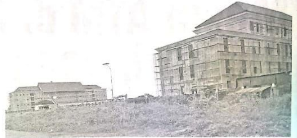
POTENSI: Kawasan Industri di Jabon yang diprediksi bakal meningkatkan iklim investasi di Sidoarjo.

"Terutama struktur jalan yang kuat, sebab akan dilewati kendaraan besar setiap harinya," pungkasnya. (nis/vga)