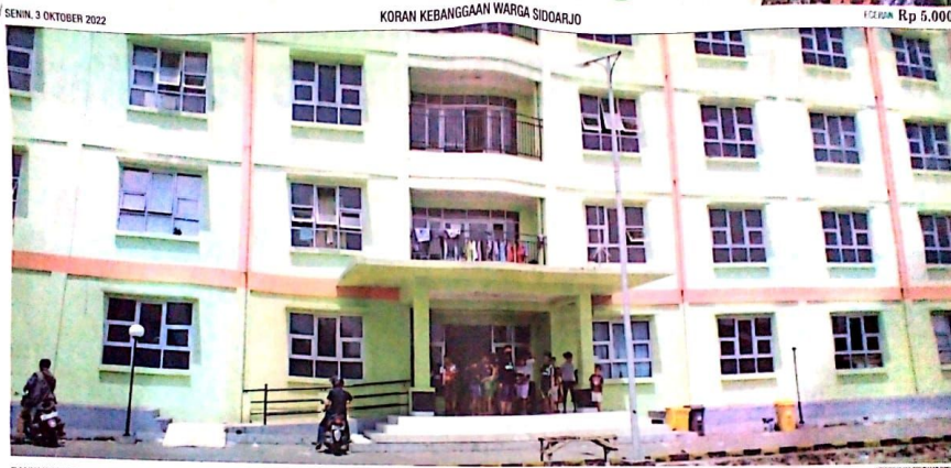
BANYAK KOSONG: Rusunawa Tambakkemerakan di Kecamatan Krian hanya diisi 20 persen dari total kapasitas.