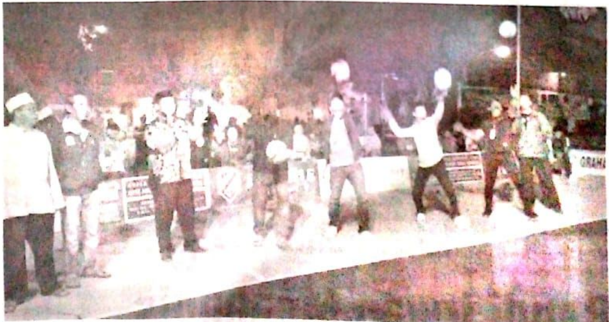
SEMANGAT: Seremonial saat pembukaan Turnamen Bola Voli di Graha Kota.

Targetnya seluruh klub di Jawa Timur bisa ikut serta. Kesempatan tersebut juga bisa dijadikan ajang untuk mencari bibit-bibit atlet yang bertanding di kancah internasional. (nis/vga)