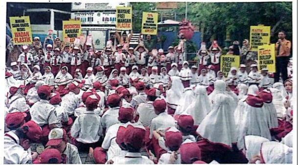
PEDULI LINGKUNGAN: Siswa bersama guru SDIT El-Haq Sidoarjo menggelar demo operasi plastik dan deklarasi stop makan plastik kemarin (9/12). Ecoton Foundation digandeng untuk memberikan edukasi plastik.

Dari hasil penelitian tersebut, para siswa jadi mengetahui langsung bahwa sungai juga tercemar mikroplastik. "Mereka dengan sadar dan inisiatif melakukan penelitian dengan didampingi Ecoton. Mereka tahu langsung bahwa di sekitar juga ada yang tercemar," katanya. Menyadari akan bahaya pencemaran tersebut, aksi nyata pun dilakukan. Caranya, dengan mengurangi penggunaan plastik sekali pakai, deklarasi stop makan plastik, dan demo operasi perubahan iklim terjadi di Indonesia, bahkan di dunia. Di akhir kegiatan, para siswa