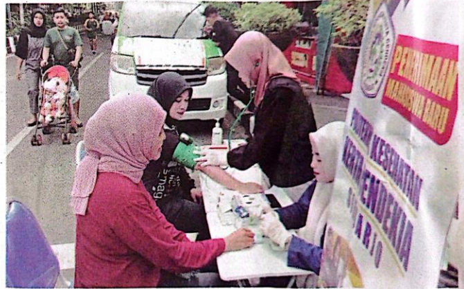
PEMERIKSAAN KESEHATAN: BMH Gerai Sidoarjo saat melaksanakan pemeriksaan kesehatan untuk menyemarakkan kegiatan Festival UMKM yang digelar di Alun-alun Sidoarjo, Minggu (8/12/2024).