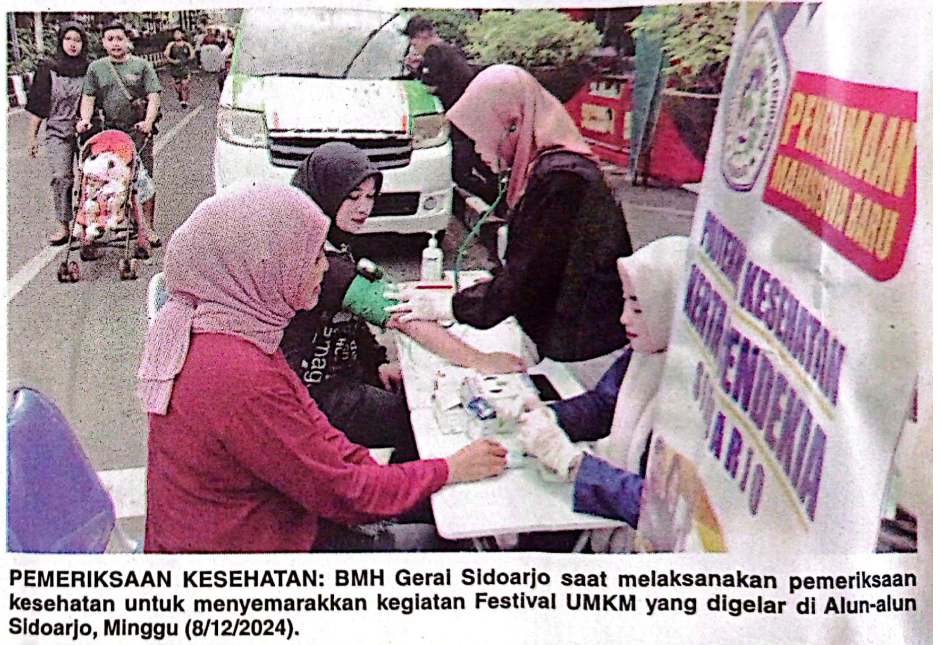
PEMERIKSAAN KESEHATAN: BMH Gerai Sidoarjo saat melaksanakan pemeriksaan kesehatan untuk menyemarakkan kegiatan Festival UMKM yang digelar di Alun-alun Sidoarjo, Minggu (8/12/2024).