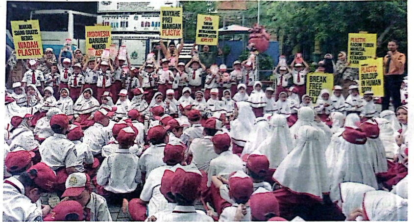
PEDULI LINGKUNGAN: Siswa bersama guru SDIT El-Haq Sidoarjo menggelar demo operasi plastik dan deklarasi stop makan plastik kemarin (9/12). Ecoton Foundation digandeng untuk memberikan edukasi plastik.

Menyadari akan bahaya pencemaran tersebut, aksi nyata pun dilakukan. Caranya, dengan mengurangi penggunaan plastik sekali pakai, deklarasi stop makan plastik, dan demo operasi plastik. "Lingkungan tidak baik-baik saja. Solusi sederhananya dengan kurangi