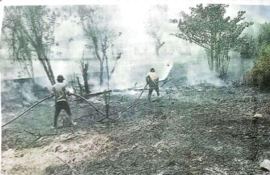
BERJIBAKU: Petugas damkar berusaha memadamkan api yang membakar lahan kosong di sebuah perumahan di Desa Tambak Sawah, Waru, kemarin (29/9).