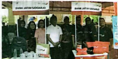
Bank Jatim Cabang Sidoarjo