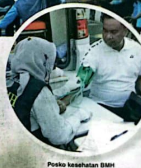
Posko kesehatan BMH