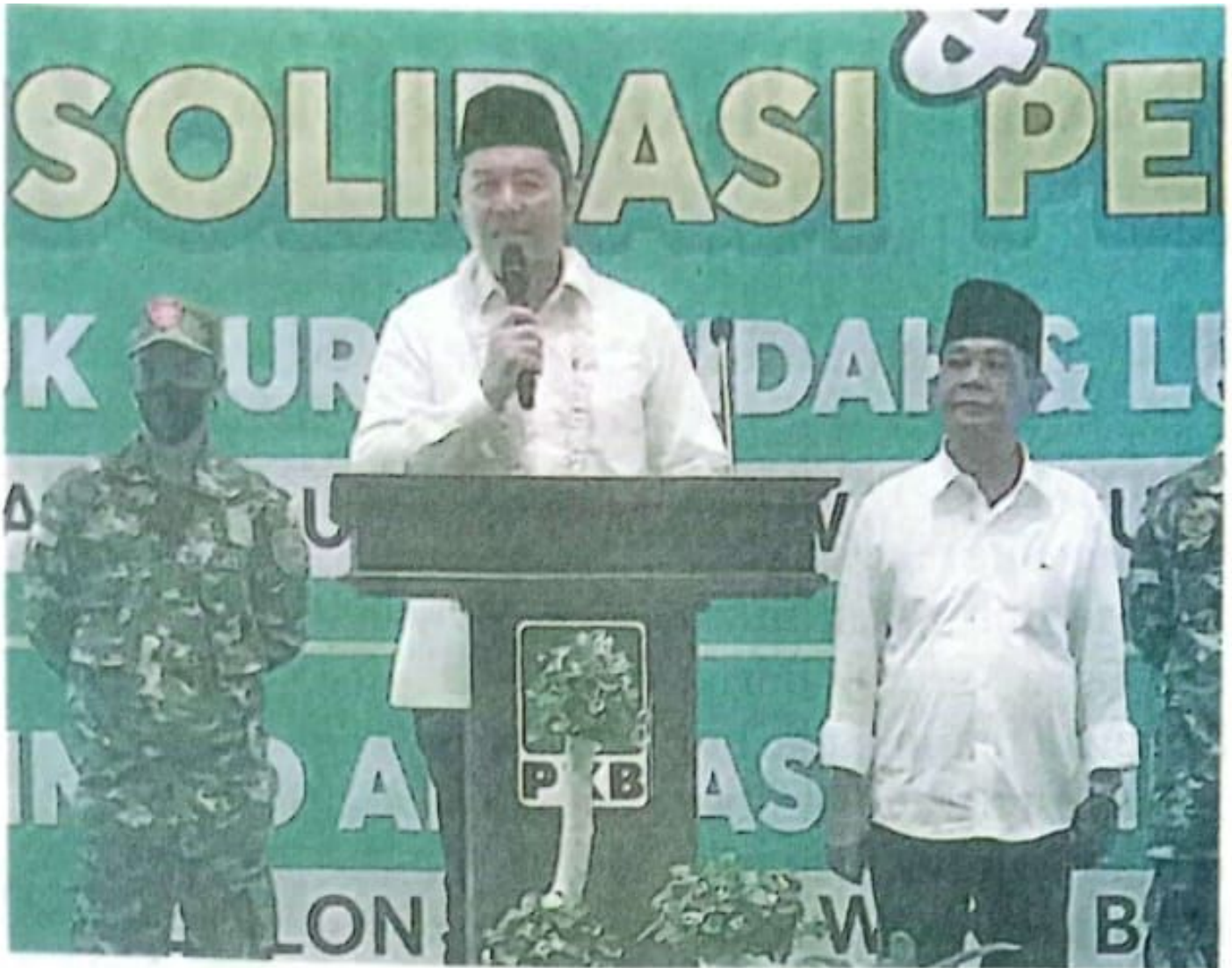
TIM SAE UNTUK JAWA POS

DEWAN PERWAKILAN RAKYAT DAERAH KABUPATEN SIDOARJO