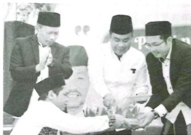
Bupati. Dalam kesempatan itu Pjs. Bupati Sidoarjo mengapresiasi pembangunan Gedung Sports Center milik SMPN 3 Krian tersebut.

"Jika sejak dini akhlak anak sudah terbentuk, insya Allah akan menjadi pribadi yang baik untuk bangsa dan negara serta orang tuanya. Disisi lain, Peran orang tua juga sangat berpengaruh terhadap perkembangan individu anaknya," ujar Pjs.