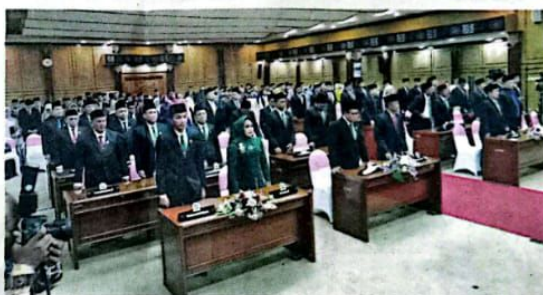
SEMANGAT : Anggota DPRD Sidoarjo periode 2024-2029 saat dilantik.

Selanjutnya, menetapkan mekanisme kerja DPRD. Tata tertib mengatur mekanisme kerja DPRD, mulai dari pembentukan panitia khusus, tata cara pengambilan keputusan, hingga tata cara pengajuan usul. Dengan demikian, setiap tahapan kerja DPRD me-