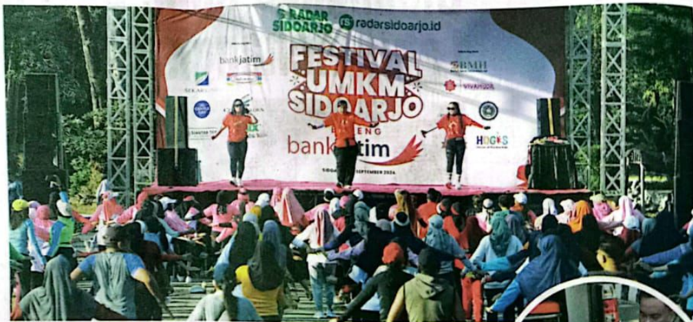
SEMANGAT : Senam aerobik yang dihadiri ribuan peserta menjadi pembuka kegiatan Festival UMKM bareng Bank Jatim di Alun-alun Sidoarjo.

nyampaikan apresiasinya terhadap inisiatif Radar Sidoarjo bersama Bank Jatim yang turut mendukung perekonomian daerah. Ia menekankan pentingnya peran UMKM dalam menggerakkan roda perekonomian. "Kami sangat mengapresiasi langkah media Radar Sidoarjo bersama Bank Jatim yang memberikan wadah bagi para pelaku UMKM untuk mempromosikan produk-produk lokal. Hal ini menjadi salah satu bentuk kolaborasi positif antara media, pemerintah, dan masyarakat untuk bersama-sama memajukan perekonomian Sidoarjo," ujar Isa. (sai/vga)