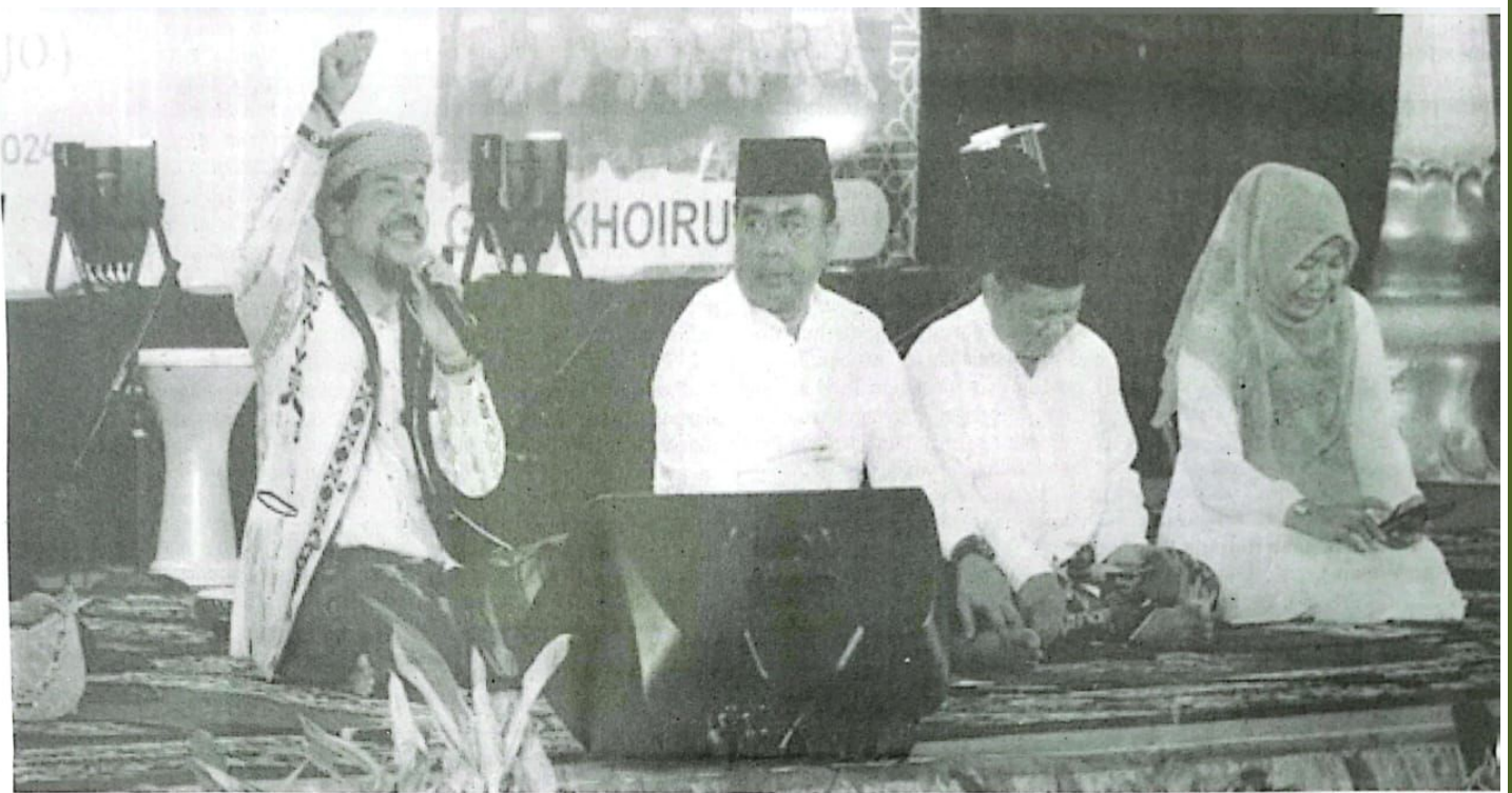
Pengajian rutin malam Ahad Pahing di Pendopo Kabupaten Sidoarjo.

DEWAN PERWAKILAN RAKYAT DAERAH KABUPATEN SIDOARJO