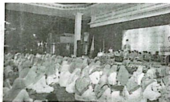
Pengajian rutin malam Ahad Pahing di Pendopo Kabupaten Sidoarjo.

Isa juga berharap melalui pengajian ini dapat menyegarkan semangat keagamaan dan keimanan dalam menjalani hidup ini. Lewat pengajian tersebut pula ia berharap para ASN serta para pendidik anak-anak yang tergabung dalam IGTKI hendaknya dapat memberikan perubahan ke arah yang lebih baik demi tercapainya peningkatan kinerja pemerintahan dan pembangunan serta pelayanan kepada masyarakat. Dengan begitu akan mendukung birokrasi yang efektif efisien dan rasional sesuai dengan tuntutan reformasi birokrasi saat ini. (nrl/jok/ep)